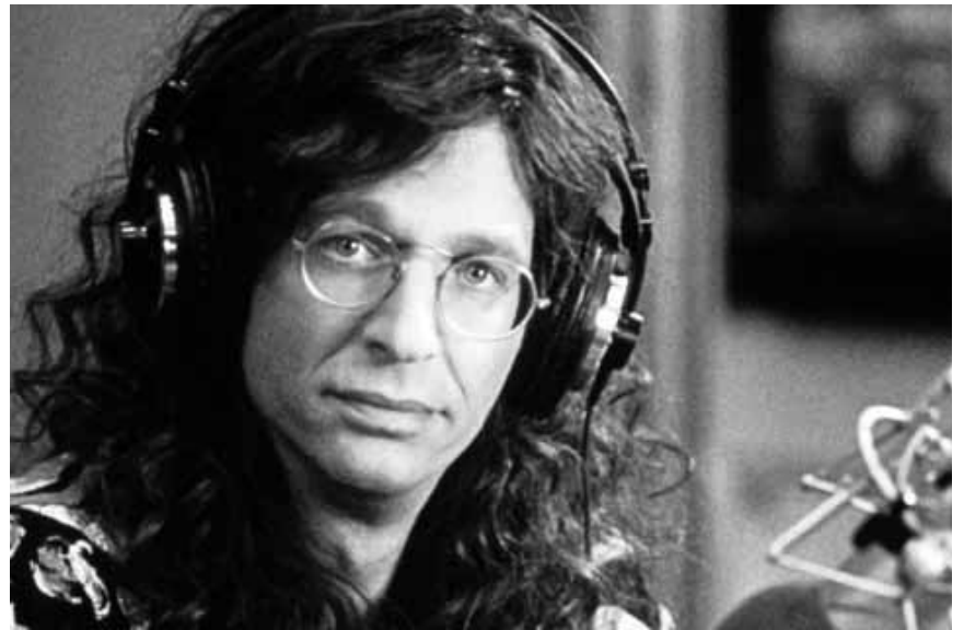
„Private Parts“ erzählt die Lebensgeschichte des legendären Radiomoderators Howard Stern, am Freitag in der Cinémathèque, im Rahmen von 20 Jahre Radio Ara.

Présentation des courts métrages qui viennent d'être finalisés l'année dernière. En guise d'ouverture de la soirée sera présenté en avant-première « Phosphoros », d'Yves Steichen et d'Yasin Özen. Egalement à l'affiche se trouvent entre autres « Gänseblümchen » de Sacha Bachim, le documentaire « Le Retour » de Charlotte Bruneau et Catherine Wurth, « Paticka Aids-Préventiounscip » de Jacques Molitor, clip musical du groupe Spleen « Shadows » de Julie Schroell. Deux projet scolaires « Schalt em » de Fabrice Genot et un court reportage sur les questions énergétiques.