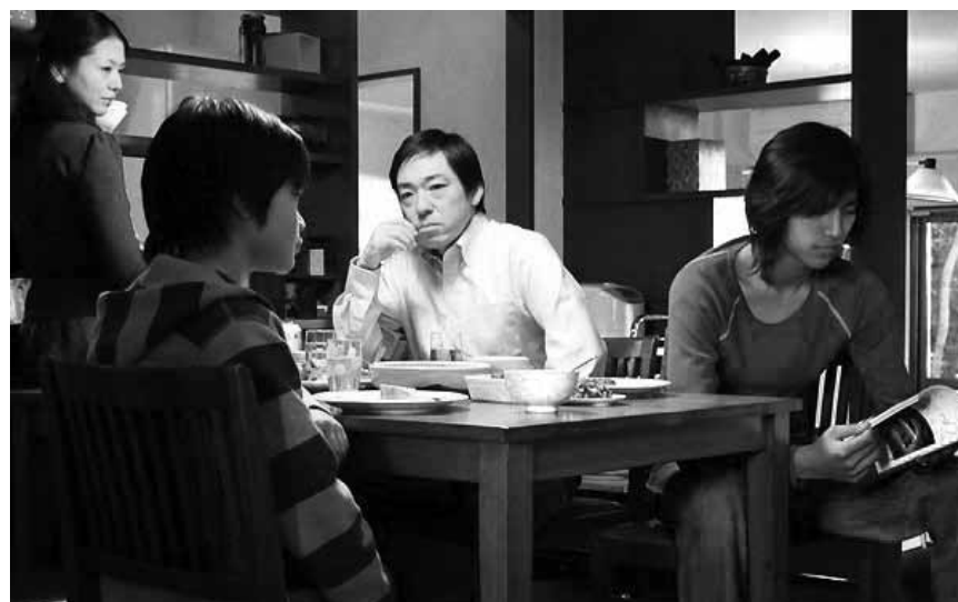
Der langsame soziale Abstieg der Familie Sasaki: „Tokyo Sonata“, am Mittwoch im CinéBelval, in Zusammenarbeit mit der japanischen Botschaft.

XXXX = excellent XXX = bon XX = moyen X = mauvais