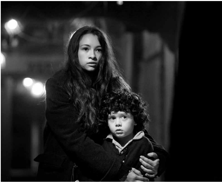
Wenn es kein Rattenfänger ist, wer entführt dann die Kinder der kleinen Bergbaustadt? „Tall Man“, neu im Utopolis.