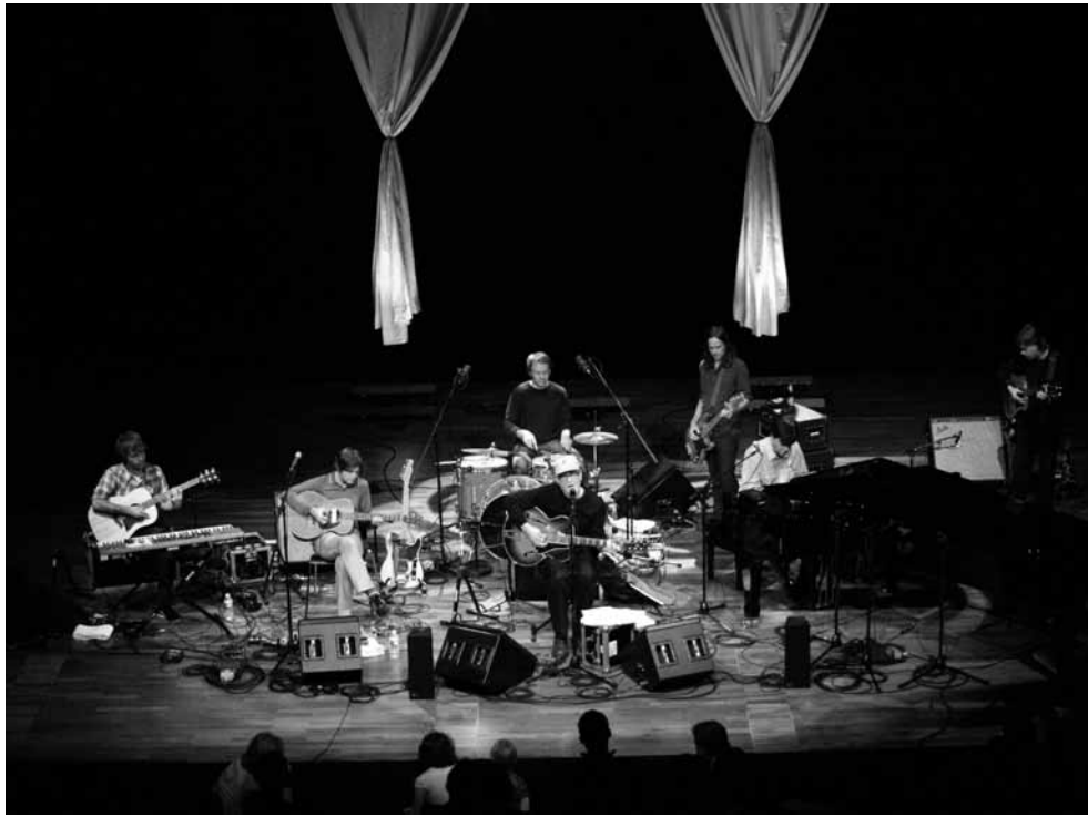
Konstante Bedächtigkeit zeichnet Lambchop aus.