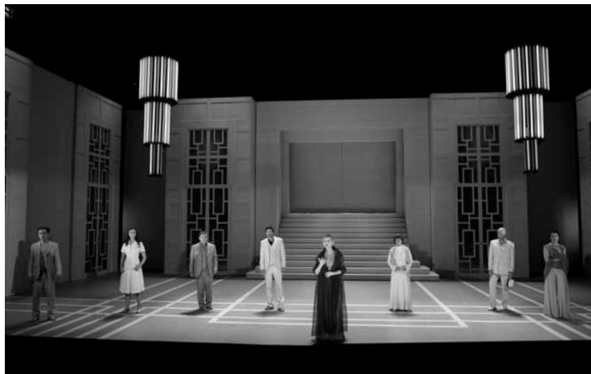
« Se trouver », une pièce de l'écrivain italien Luigi Pirandello, encore ce vendredi, 26. octobre, au Grand Théâtre.