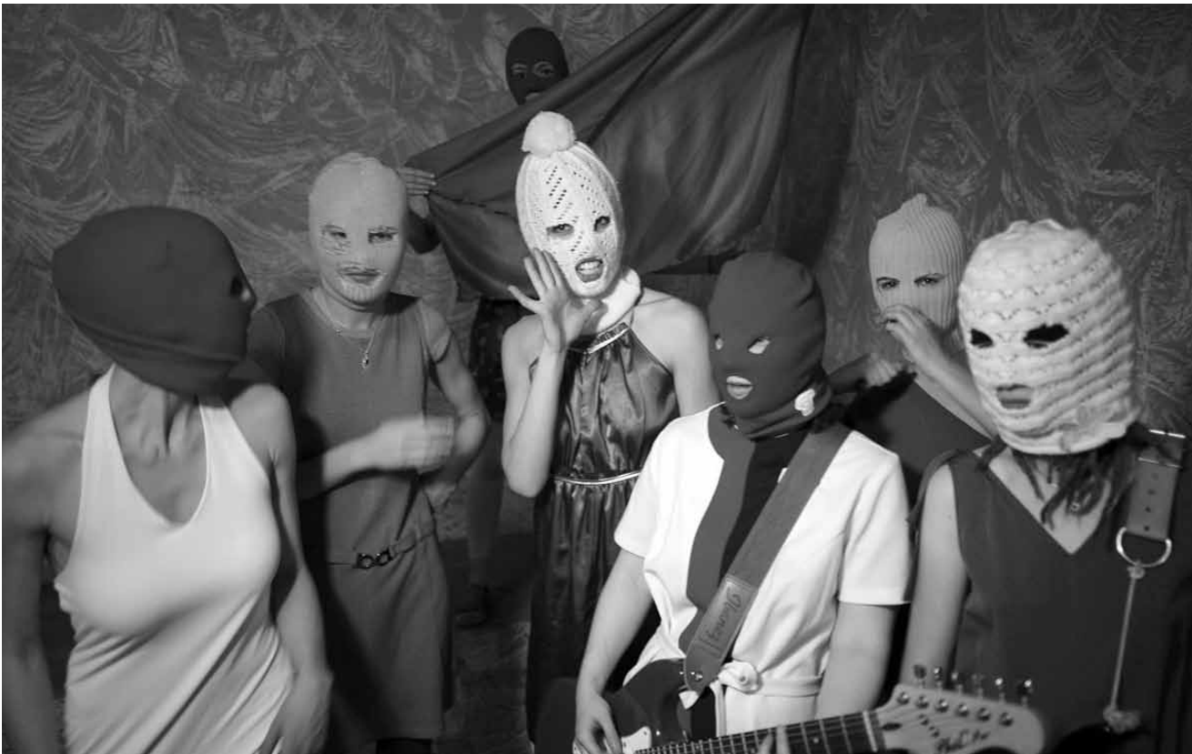
C'est pas pour Halloween, car c'est politique : le « Pussy Riot Band Aid », projet de support des punkeuses moscovites, manifestera sa solidarité à l'Entrepôt d'Arlon, ce samedi 27 octobre.

Aladin und die Wunderlampe , lyrische Märchenoper von Nino