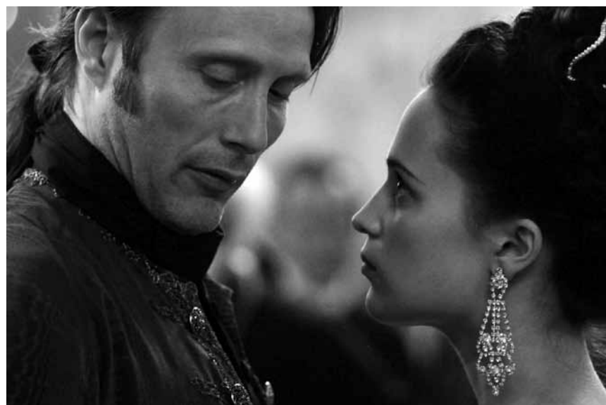
Auch schon im 18. Jahrhundert wurde bei den Royals intrigiert was das Zeug hält : „En kongelig affære“, neu im Utopia.

Nach ihrer Afrika-Flucht wollen Löwe Alex, Zebra Marty, Giraffe Melman und Nilpferd Gloria wieder zurück nach New York. Einige Pannen später stranden sie in Monaco, wo sie auf die Pinguine sowie den Lemurenkönig Julien treffen. Auf ihrer Flucht quer durch Europa schließen sich sie sich zu Tarnungszwecken einem Wanderzirkus an, um so heimlich wieder zurück in den Zoo New Yorks zu kommen.