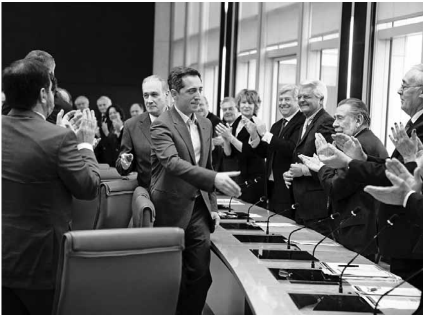
Un jeune loup entouré de vieux lions : qui va manger qui dans la jungle de la finance ?