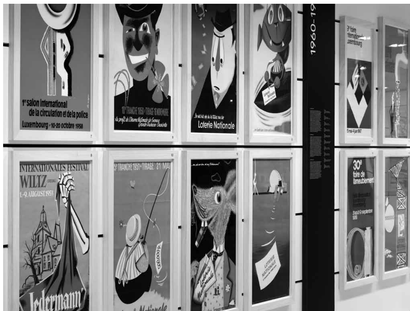
L'art de l'affiche au Luxembourg après 1945 : une sélection d'une cinquantaine d'affiches créées par la famille Weyer, engagée de génération en génération dans la création graphique à Luxembourg. Au Musée d'Histoire de la Ville, jusqu'au 31 décembre 2013.

gravures à l'eau-forte et à l'aquatine, Musée de la Cour d'Or (2, rue de Haut Poirier, tél. 0033 3 87 68 25 00), jusqu'au 28.1, lu., me. - ve. 9h - 17h, sa. + di. 10h - 17h. Fermé les jours fériés.