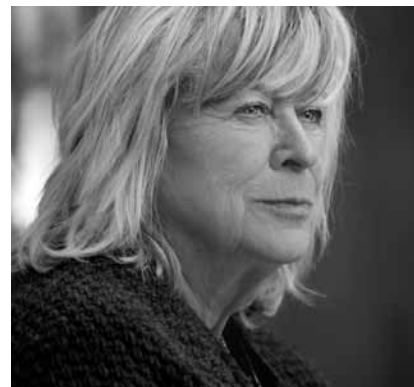
Margarethe von Trotta

Cet entretien propose un tour d'horizon de la carrière cinématographique