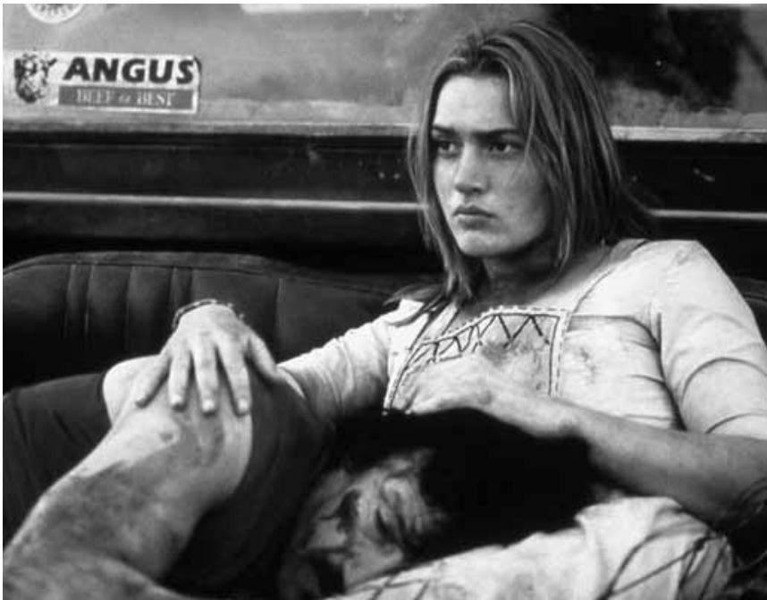
„Holy Smoke“, eine Geschichte um Macht und Unterwerfung von Jane Campion. Am Samstag in der Cinémathèque.