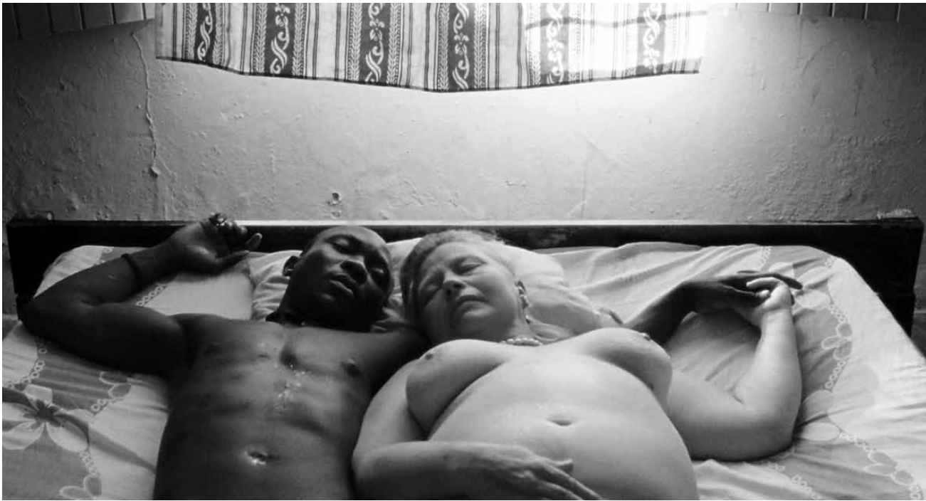
Regisseur Seidl zeigt das vermeintliche Exotik-Paradies als Neuauflage kolonialer Abhängigkeit. „Paradies: Liebe“, neu im Utopia.