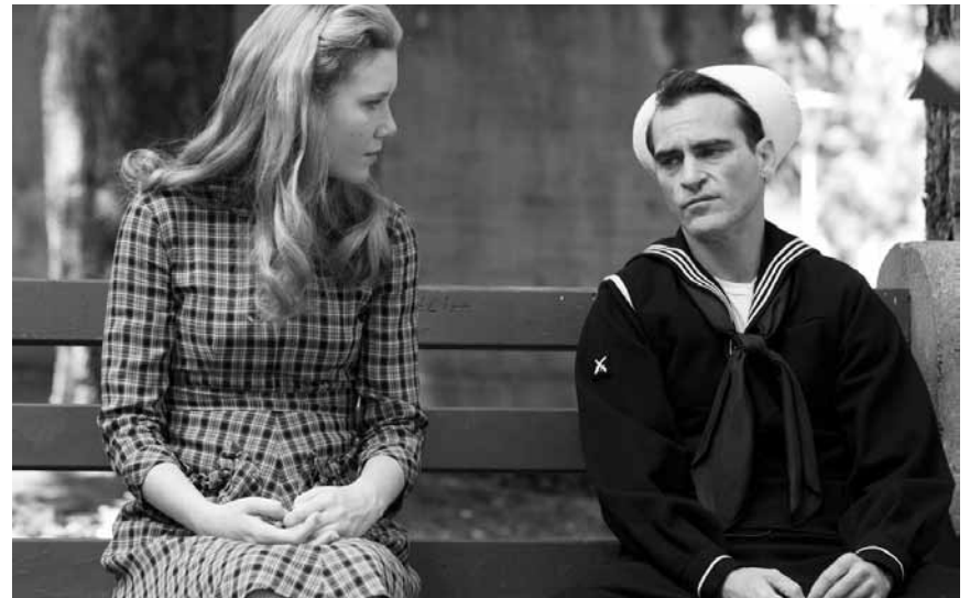
„The Master“: Episches Kino und ein Film über Menschen, die sich auf der Suche befinden. Neu im Utopolis.