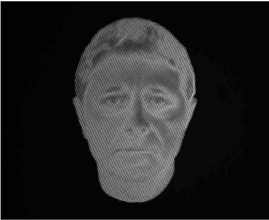
OnLAB, das Forschungsprojekt des Künstlers Michel Paysant, das unter anderem das Entstehen innovativer mikro- und nanoskopischer Kunstwerke ermöglicht. Noch bis zum 24. Februar im Mudam zu bestaunen.

NEW Galerie 1 du Centre Pompidou (1, parvis des Droits de l'Homme, tél. 0033 3 87 15 39 39), jusqu'au 1.4, lu., me. - ve. 11h - 18h, sa. 10h - 20h, di. 10h - 18h.