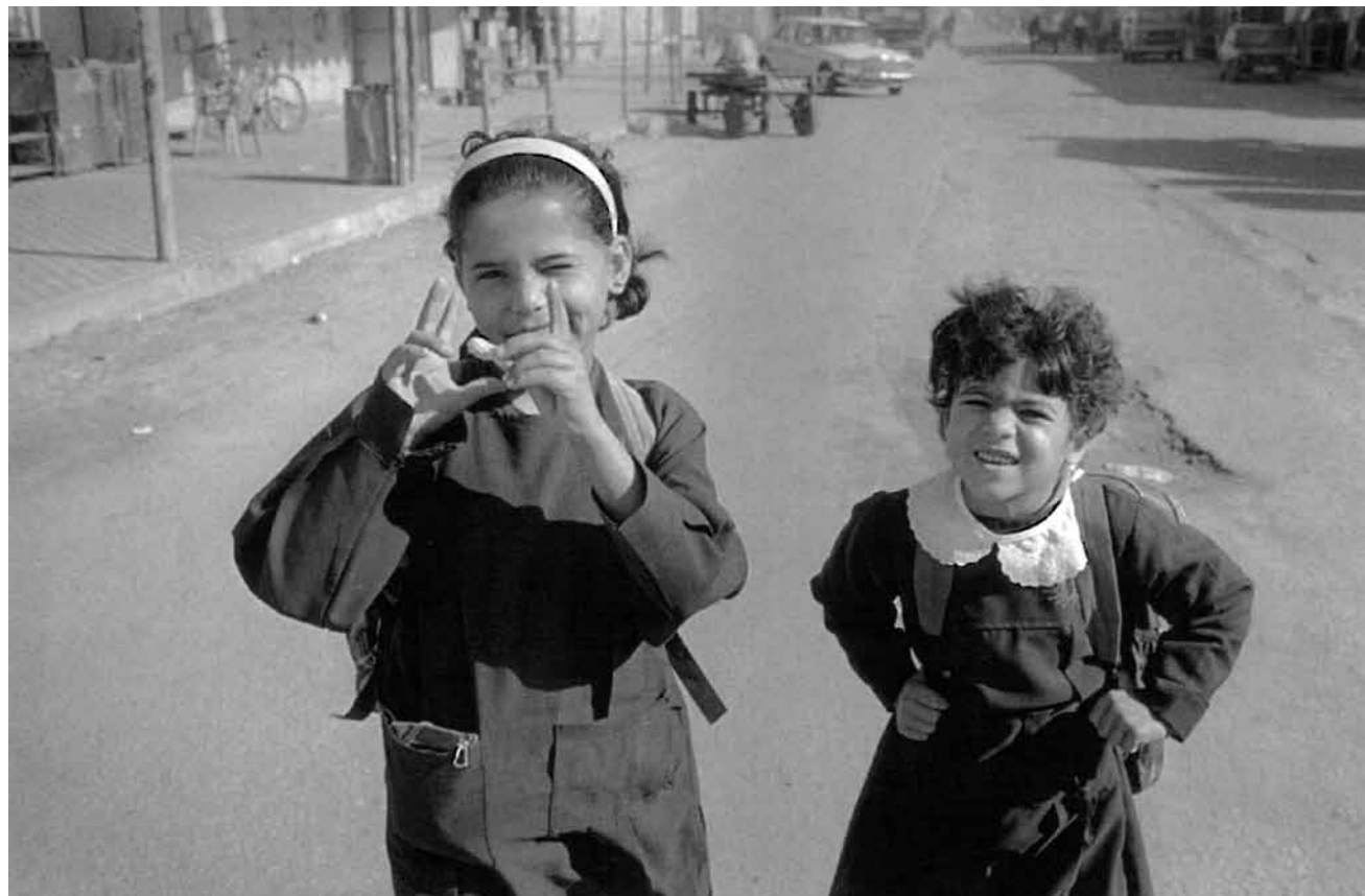
Les photos des Véronique Vercheval sont le fruit de plusieurs voyages faits en Palestine et de rencontres avec des acteurs culturels palestiniens engagés dans le projet « Masarat Palestine ». A la maison de la Culture à Arlon jusqu'au 27 janvier.

„Die Genauigkeit in Albus' Darstellung ist kaum nachzuvollziehen und es ist