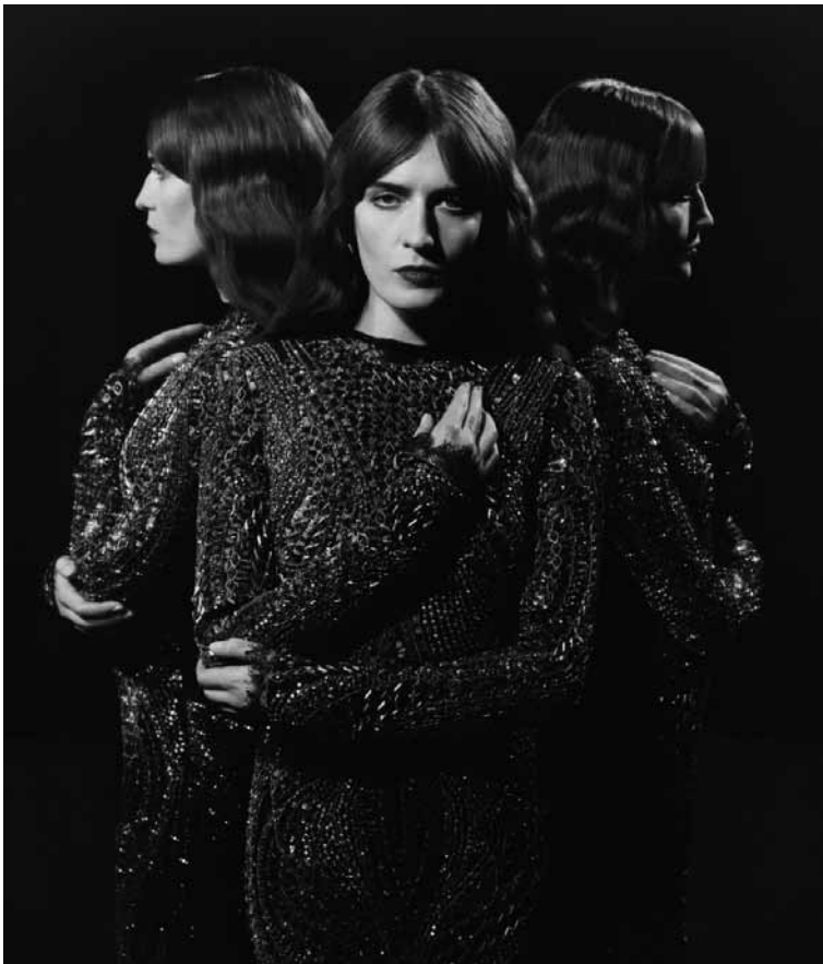
Triomphe par la télé : Florence and the Machine.