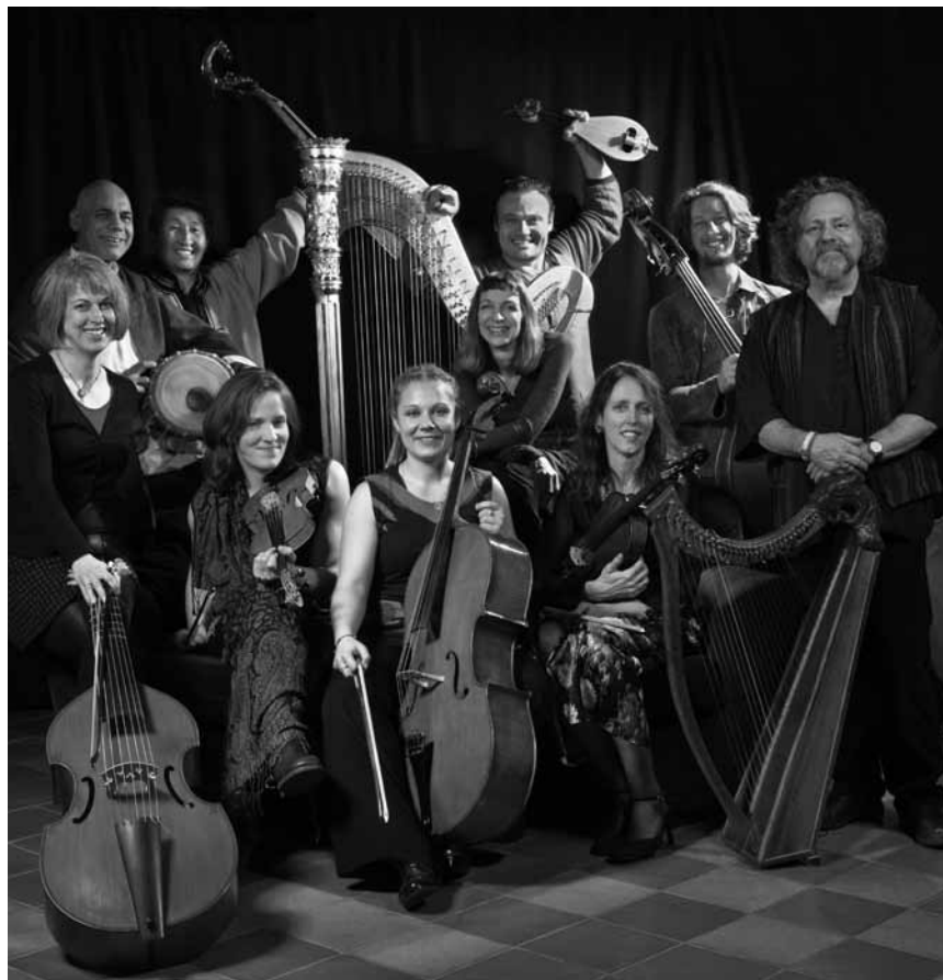
Globaler Musikgenuss pur: Die Global Strings präsentieren am 8. Dezember Oppermanns Klangwelten in der Abtei Neumünster.

Kentucky Bridgeburners , Spirit of 66, Verviers (B), 20h. www.spiritof66.be