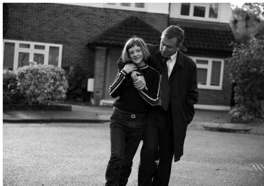
Eine Kindheit im Schatten von Krankheit und Ausschließung: „Broken“, neu im Utopia.

E 2009, film d'animation pour enfants de Rodolfo Pastor. 42'. V.o. sans parole. Ciné Goûter.