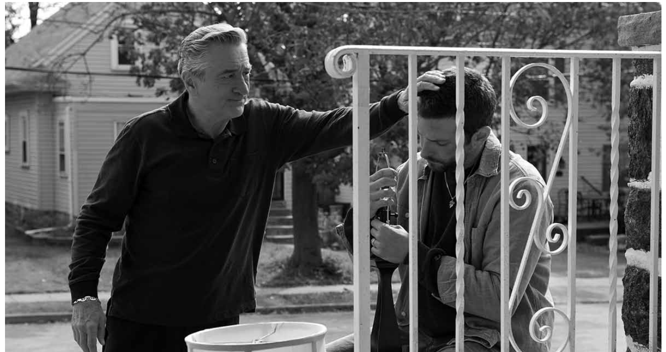
Pat, ein depressiver Enddreißiger, ist wieder bei Vater und Mutter eingezogen. „Silver Linings Playbook“, neu im Utopolis.

Ende der 1940er Jahre beherrscht der Mafia-König Mickey Cohen den Untergrund von L.A. Er zieht seine Gewinne aus Drogen- und Waffenschmuggel, Prostitution