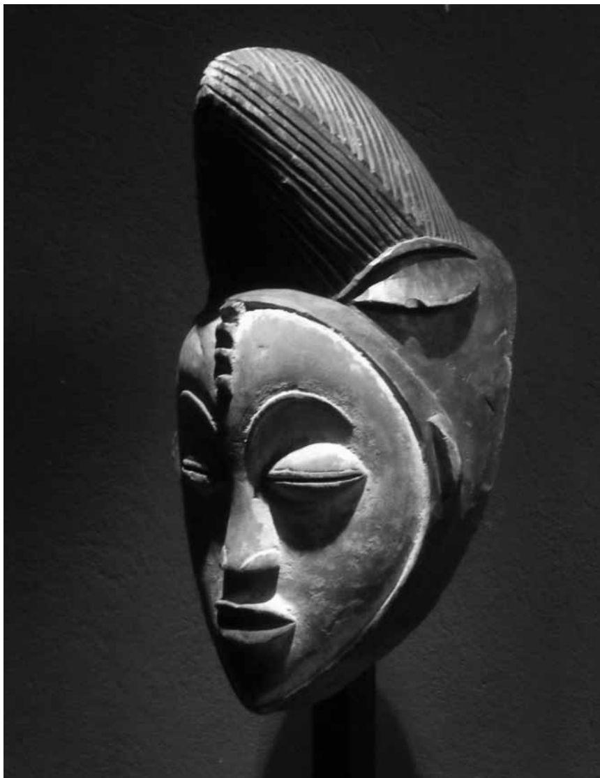
Les amateurs de masques africains pourront admirer entre autres celui-ci du peuple Punu. Jusqu'au 20 avril à la galerie Nosbaum et Reding.