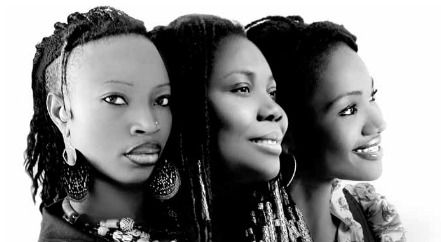
L'Afrique acoustique et au féminin : « La voix des femmes » est à la Maison de la Culture d'Arlon le 28 février.