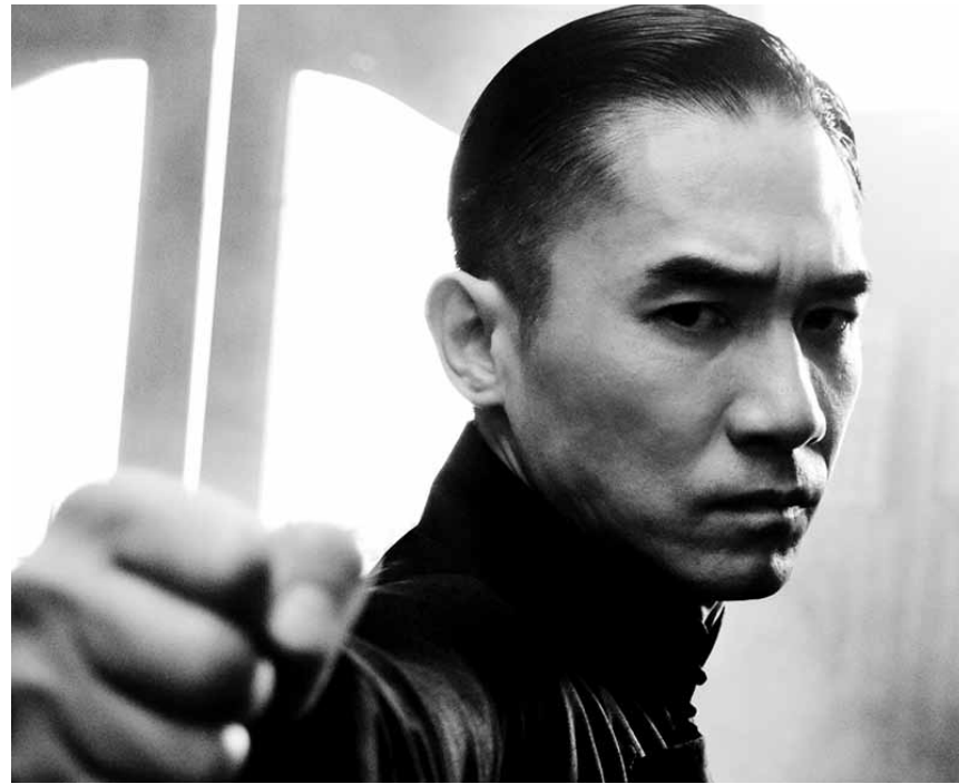
Der chinesische Starregisseur Wong Kar-Wai meldet sich mit dem dramatischen Kung-Fu-Film - in dem auch Frauen kämpfen dürfen - „The Grandmaster“ zurück. Neu im Utopia.

China 1936: Die japanische Invasion, die den zweiten japanisch-chinesischen Krieg auslöst, steht kurz bevor. Der aus dem Süden Chinas stammende Kung-Fu-Meister Ip Man trifft in seinem Heimatort Foshan erstmals auf Gong Er, eine Kung-Fu-Meisterin aus dem Norden Chinas. Gong Ers Vater Gong Baosen, ein sehr bekannter Großmeister, ist ebenfalls dort. Dieser soll in Foshan mit einer Zeremonie im berühmten Bordell Gold Pavillon als Kämpfer verabschiedet werden.