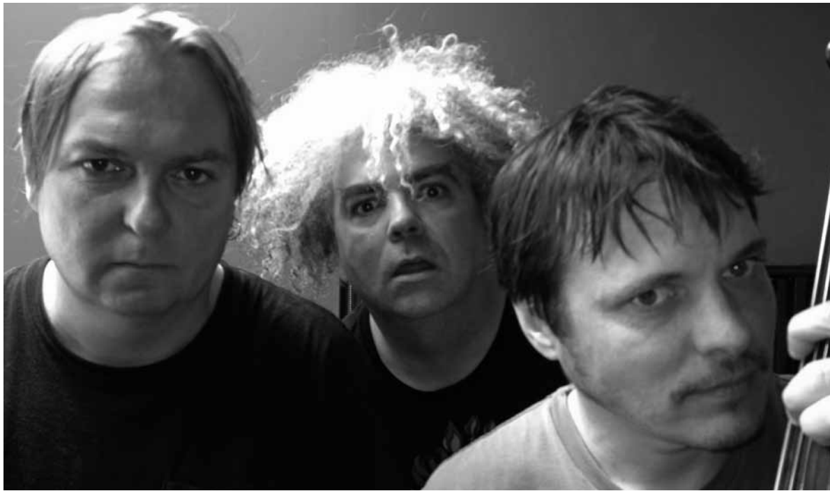
Scheren sich schon seit 30 Jahren nicht um ihr Image: die Melvins.