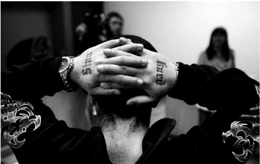
Für einige ist der 18. Geburtstag ein Grund zu feiern, andere müssen dann flüchten. Sie verlieren ihr Bleiberecht in Norwegen. „Nowhere Home“, am Montag im Utopia.

Nachdem er Zeuge wurde, wie seine Einheit in Afghanistan ausgelöscht wurde, lebt Joey Jones in den Straßen Londons und versucht, seine traumatische Vergangenheit zu vergessen und sich aus Schwierigkeiten rauszuhalten. Als