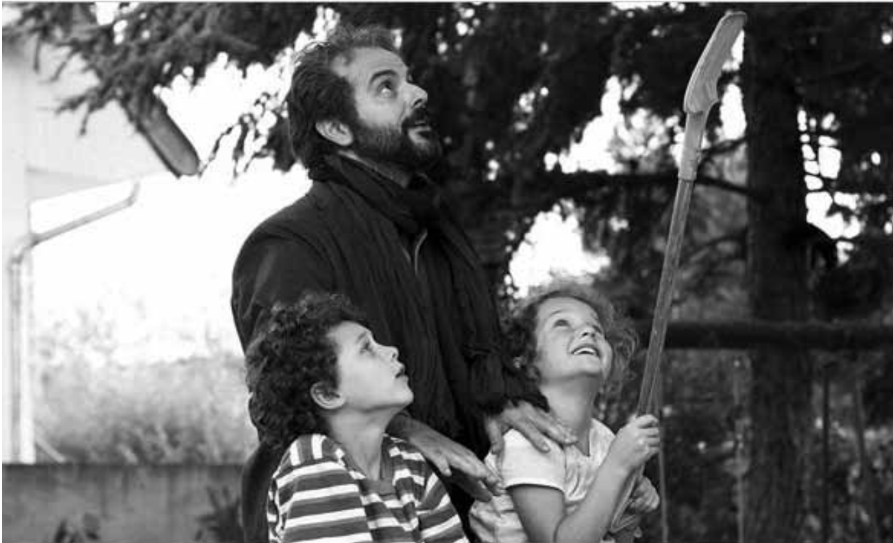
In „Le passé“ begegnet dem Zuschauer eine Patchworkfamilie mit viel Sprengstoff.