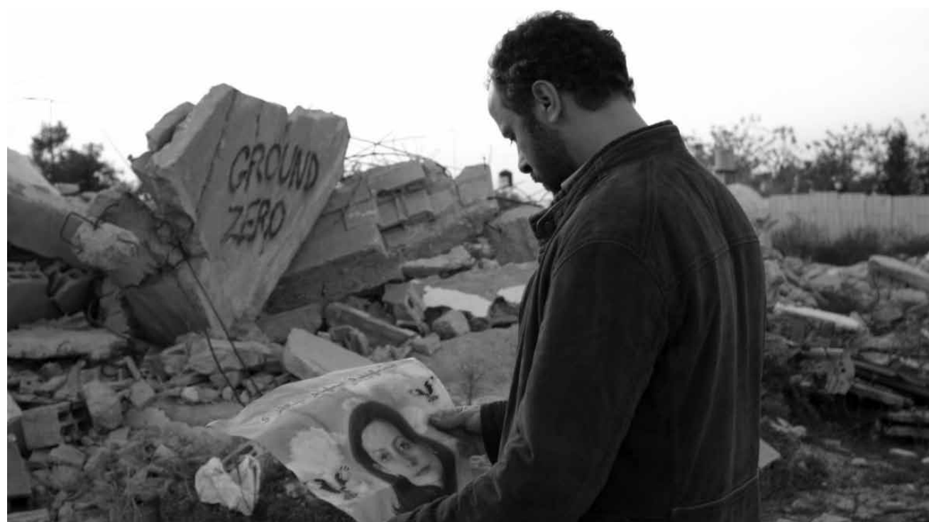
Le pourquoi du conflit israélo-palestinien et la quête éperdue pour approcher les raisons qui ont pu motiver des agressions sont au milieu du film „L'attentat“. Nouveau à l'Utopia.