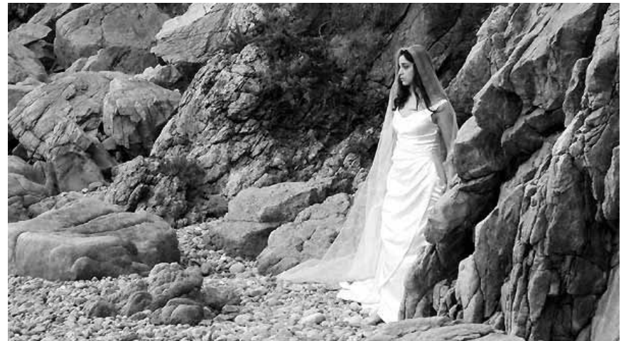
Beau décor pour des photos de mariés : „Il regista di matrimoni“, vendredi à la cinémathèque.

F 1998 de Francis Veber. Avec Thierry Lhermitte, Jacques Villeret et Francis Huster. 80'. V.o.