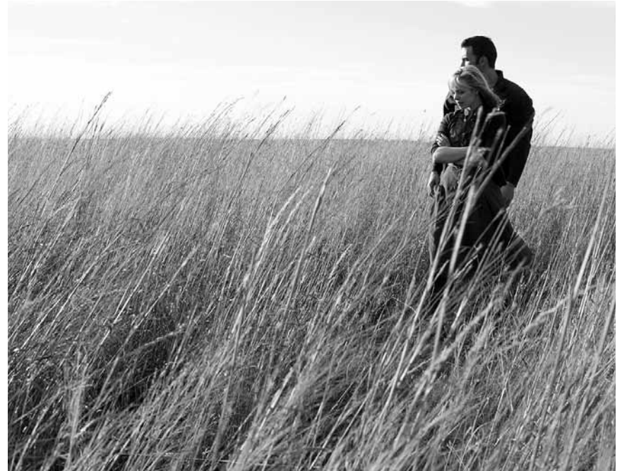
Muss Liebe schön sein! „To the wonder“, neu im Utopia.

Julian lebt seit zehn Jahren in Bangkok im Exil, nachdem er einen Polizisten umgebracht hat. Er leitet einen Thai-Box-Club als Fassade für