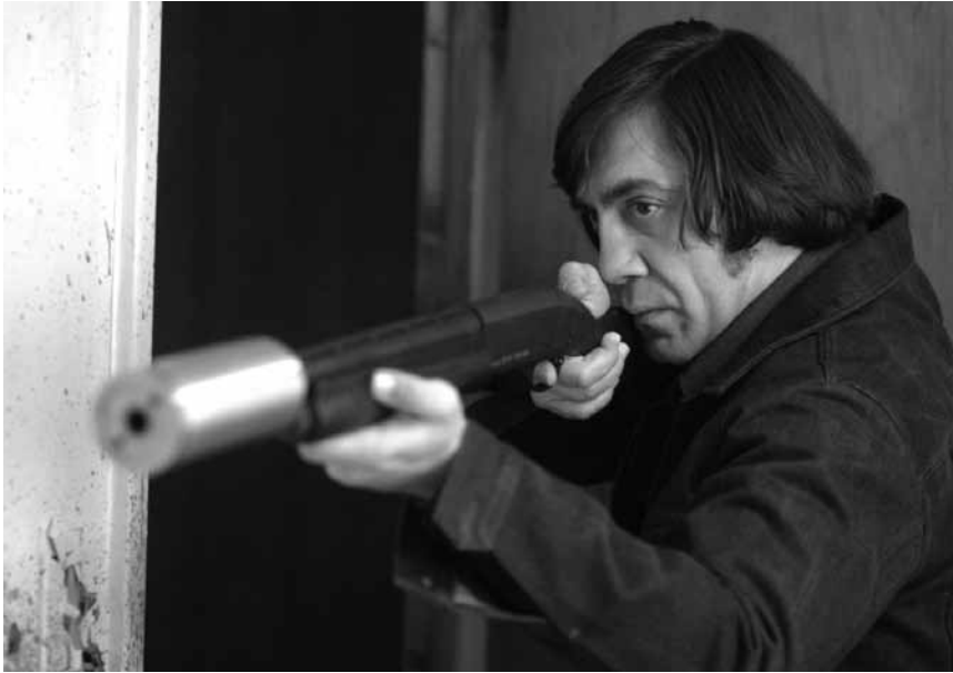
Javier Bardem in seiner wohl verstörendsten Killer-Rolle: „No Country for Old Men“, am Freitag in der Cinémathèque.