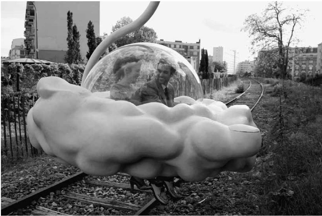
Décors, personnages et répliques - l'univers de Boris Vian prend vie dans l'adaptation de Michel Gondry.