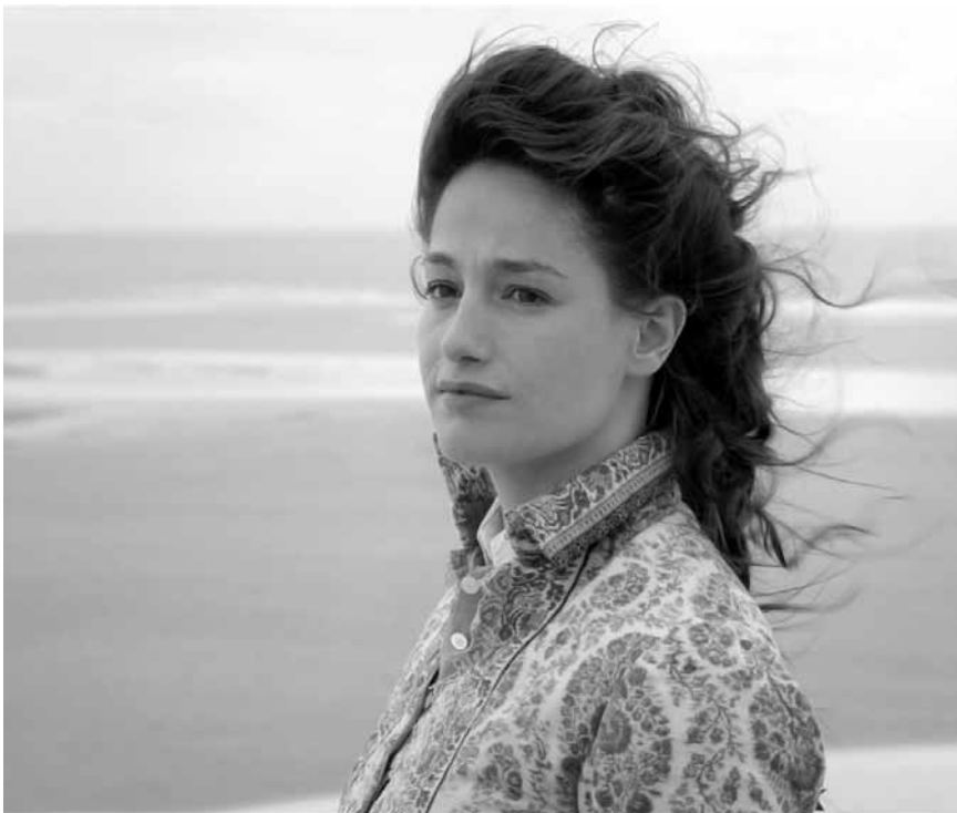
Dans « Landes » une jeune veuve décide de continuer le rêve fou de son mari, coûte que coûte. A l'Utopia, dans le cadre des « summer follies ».

Liebe Leserinnen, liebe Leser, Die woxx veröffentlicht an dieser Stelle nur die Kinotermine, die von der Druckausgabe tatsächlich erfasst werden, d.h. von Freitag bis Dienstag. Die Spielzeiten von Mittwoch und Donnerstag finden Sie dafür auf der Internetseite der woxx.