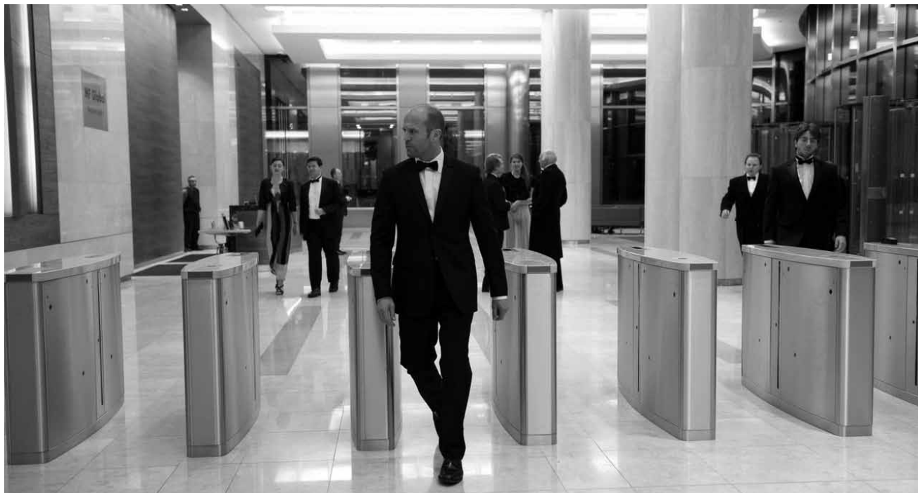
Ein Soldat, der den Afghanistan-Krieg nur vergessen will, nimmt die Identität eines Fremden an: „Hummingbird“, neu im Utopolis.

D 2013 von Dagmar Seume. Mit Sophia Münster, Jana Münster und Suzanne von Borsody. 87'. O.-Ton. Für alle.