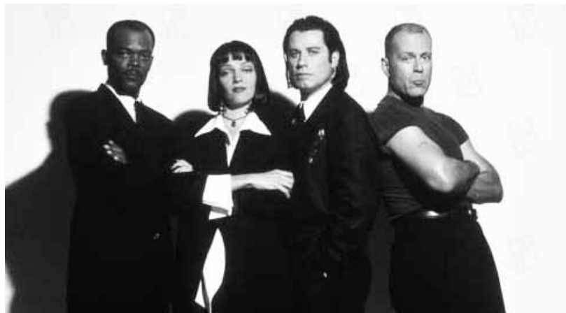
Samuel L. Jackson, Uma Thurman, John Travolta, Bruce Willis dans « Pulp Fiction » de Quentin Tarantino, Open Air à Esch.

On a deux tueurs, dont l'un cite la Bible avant de finir son travail, l'amie de leur chef qui devrait y aller plus doucement avec la drogue, un boxeur en fuite parce qu'il a gagné un match qu'il avait promis de perdre... Tarantino joue le jeu du film à épisode et reçoit pour son originalité la Palme à Cannes.