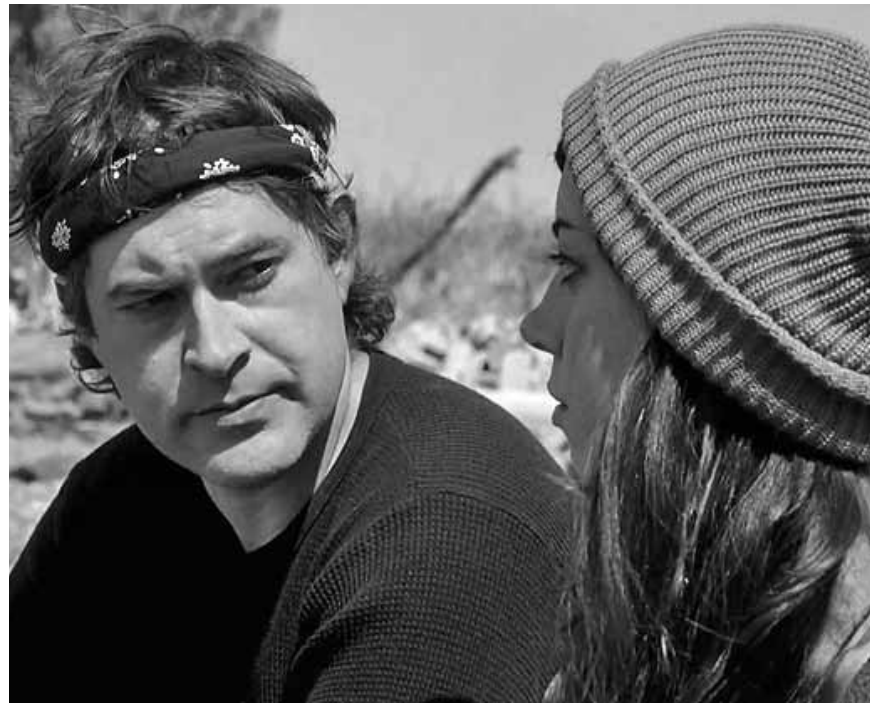
Das wird wohl nichts mit der Reiseversicherung: In „Safety Not Guaranteed“ geht es um Zeitreisen - neu im Utopia, im Rahmen der Summer Follies.