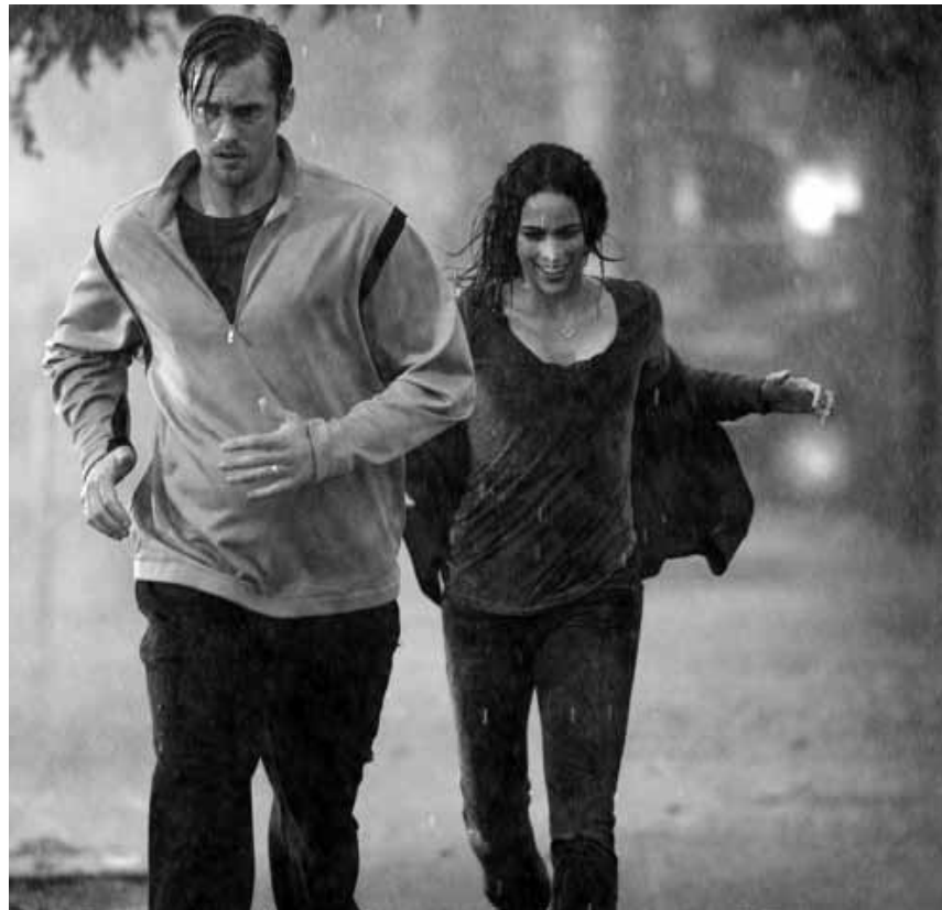
Macht das Internet einsame Psychopathen aus uns? Der Frage geht „Disconnect“ auf den Grund. Neu im Utopolis.

Mit seinem Gatsby ist Luhrmann wahrlich kein großer Wurf gelungen, sondern einmal mehr ein flacher, flimmernder Unterhaltungsfilm. (avt)