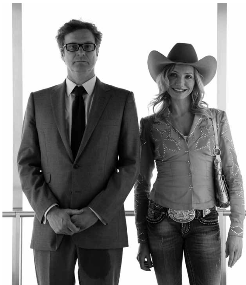
Colin Firth und Cameron Diaz in "Gambit" von Michael Hoffman, Open Air in Diekirch.

um lechternacher Séi / op der Kluuster / bei der Brill Schoul