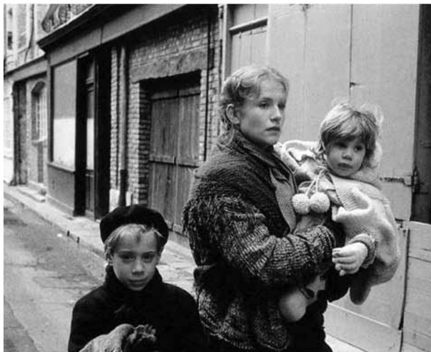
Le sort d'une femme sous l'Occupation, revu par le maître de la Nouvelle Vague : « Une affaire de femmes » de Claude Chabrol, mardi à la Cinémathèque.