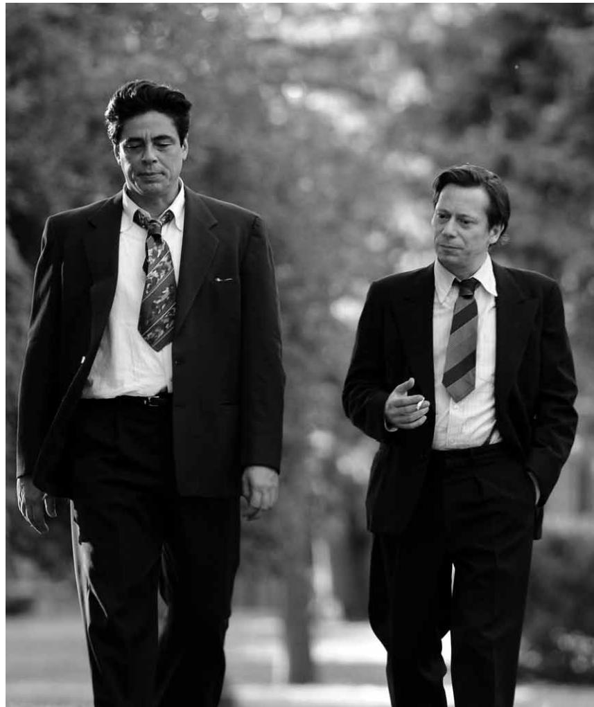
Dans « Jimmy P. », un Indien Blackfoot doit exorciser ses démons avec l'aide d'un psychiatre - nouveau à l'Utopia.