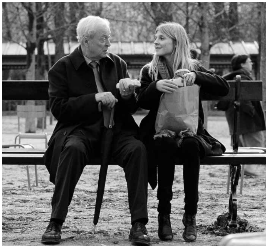
Michael Caine blüht im hohen Alter noch einmal so richtig auf, in „Mr Morgan's Last Love“. Neu im Utopia.

und zurücktreten will. Dies wirkt sich auf das Leben aller vier Musiker aus. Der zweite Violinist Robert, will unter einem neuen Cellisten häufiger die erste Geige spielen können. Davon wollen der erste Violonist Daniel und Violaspieler Jules, die auch Roberts Ehefrau ist, jedoch nichts hören. xxx Fachkundige Schauspieler zeigen, wie hochqualifizierte Musiker sich nicht nur musikalisch sehr nahe kommen, sondern dass sie sich auch persönlich nicht aus dem Weg gehen können. (lg)