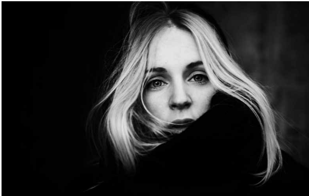
Keine leichte Muse: Agnes Obel.