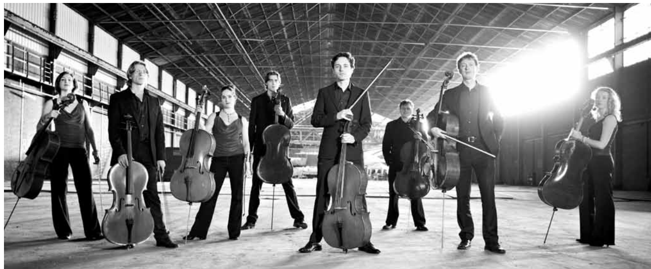
Die Philharmonie bietet eine musikalische Reise mit acht Cellos an. Das Konzert „Cellosturm“ an diesem Samstag, dem 15. und Sonntag, dem 16. März ist besonders für Jugendliche geeignet.

Tod in Venedig , Lesung mit Luc Feit, auf dem Cello begleitet von