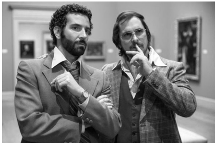
« American Hustle » ist hier Synonym für Betrug und Abzocke. Das neue Drama von Regisseur David O. Russell ist im Utopolis zu sehen.