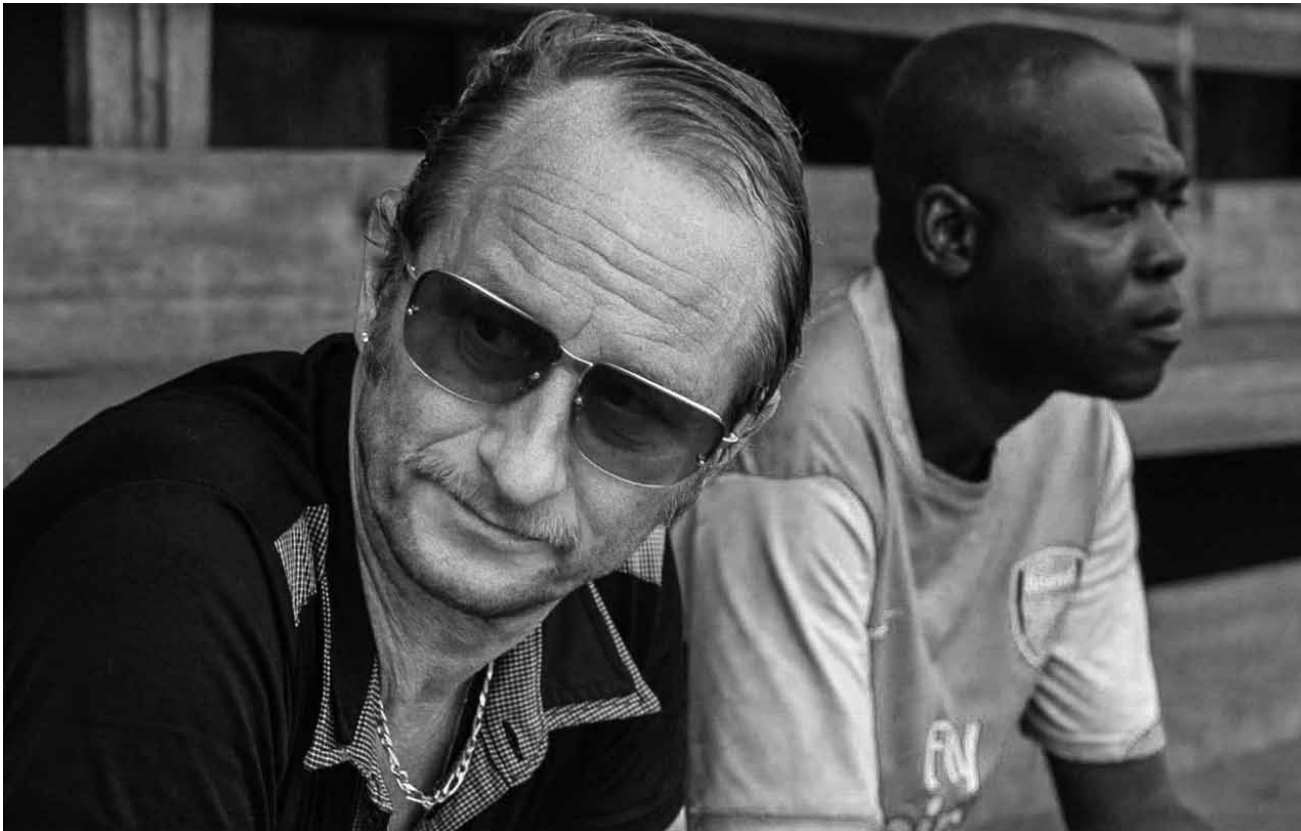
Dans la vie rien n'est blanc ou noir : « Les rayures du zèbre » de Benoît Mariage met en relief les rapports entre l'Europe et l'Afrique. Une comédie dramatique à voir à l'Ariston, au Ciné Waasserhaus et à l'Utopolis.