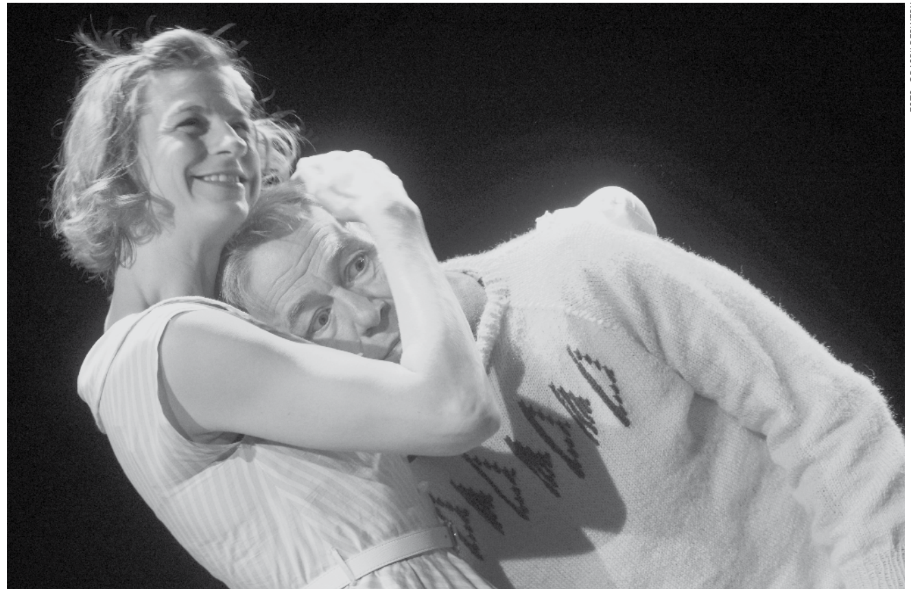
Das Jugend-Theaterstück „Das Buch von allen Dingen“ zeigt die Welt aus der Sicht des Jungen Thomas. - Ein Plädoyer für mehr Mut gegen häusliche Gewalt an Kindern. Am Sonntag, dem 2. März um 16 Uhr im Mierscher Kulturhaus.

Screening Shorts , projection de courts métrages, Casino Luxembourg - Forum d'art contemporain, Luxembourg , 16h. Tél. 22 50 45. Dans le cadre du Discoveryzone Filmfestival.