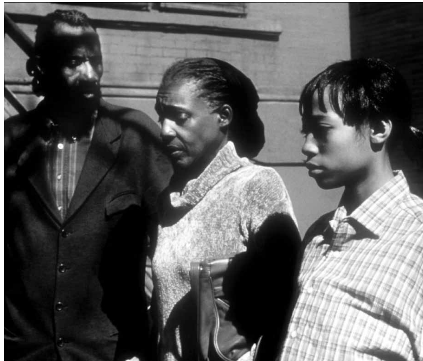
L'histoire de l'esclavage revécue par un guide touristique : « Little Senegal », mardi à l'Utopia dans le cadre de « EcranAPart ».

Violet, unangefochtenes Familienoberhaupt, sorgt mit ihrer direkten Art seit jeher für eine maßgebliche Distanz zwischen Eltern und Nachwuchs.