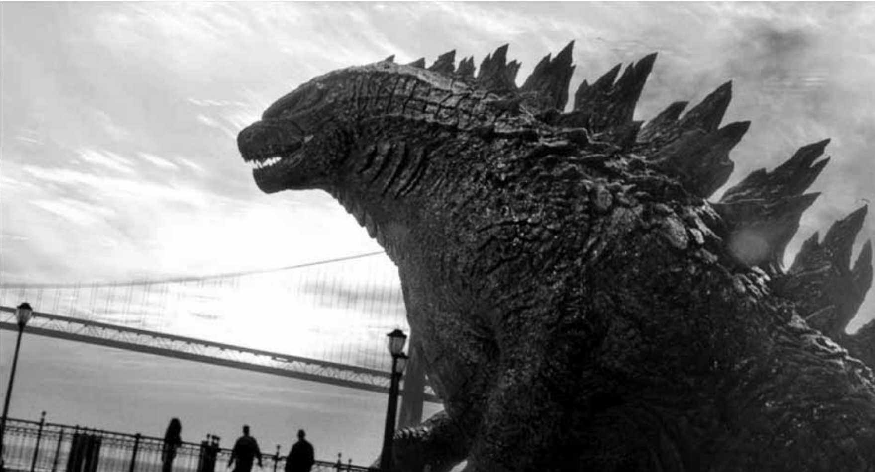
Frisch aufgebrüht kehrt „Godzilla“ auf die Leinwand zurück. Neu in den Kinos.