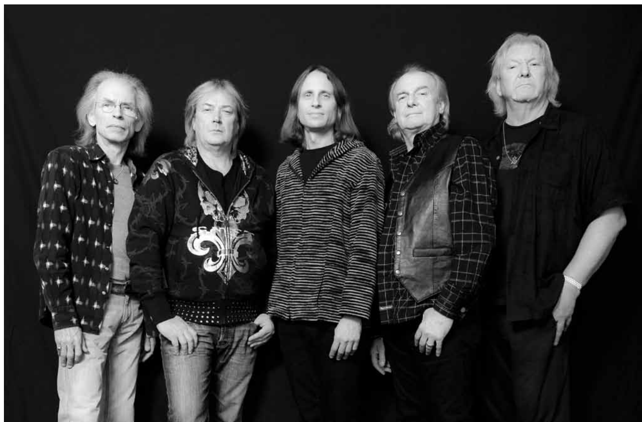
Da sagt man nicht Nein: Die Alt-Prog-Rocker von Yes werden am 20. Mai in der Rockhal vergangene Zeiten zum Leben erwecken.

Récital de piano et de flûte , par Khatia Buniatishvili et Emmanuel Pahud, oeuvres de Schumann,