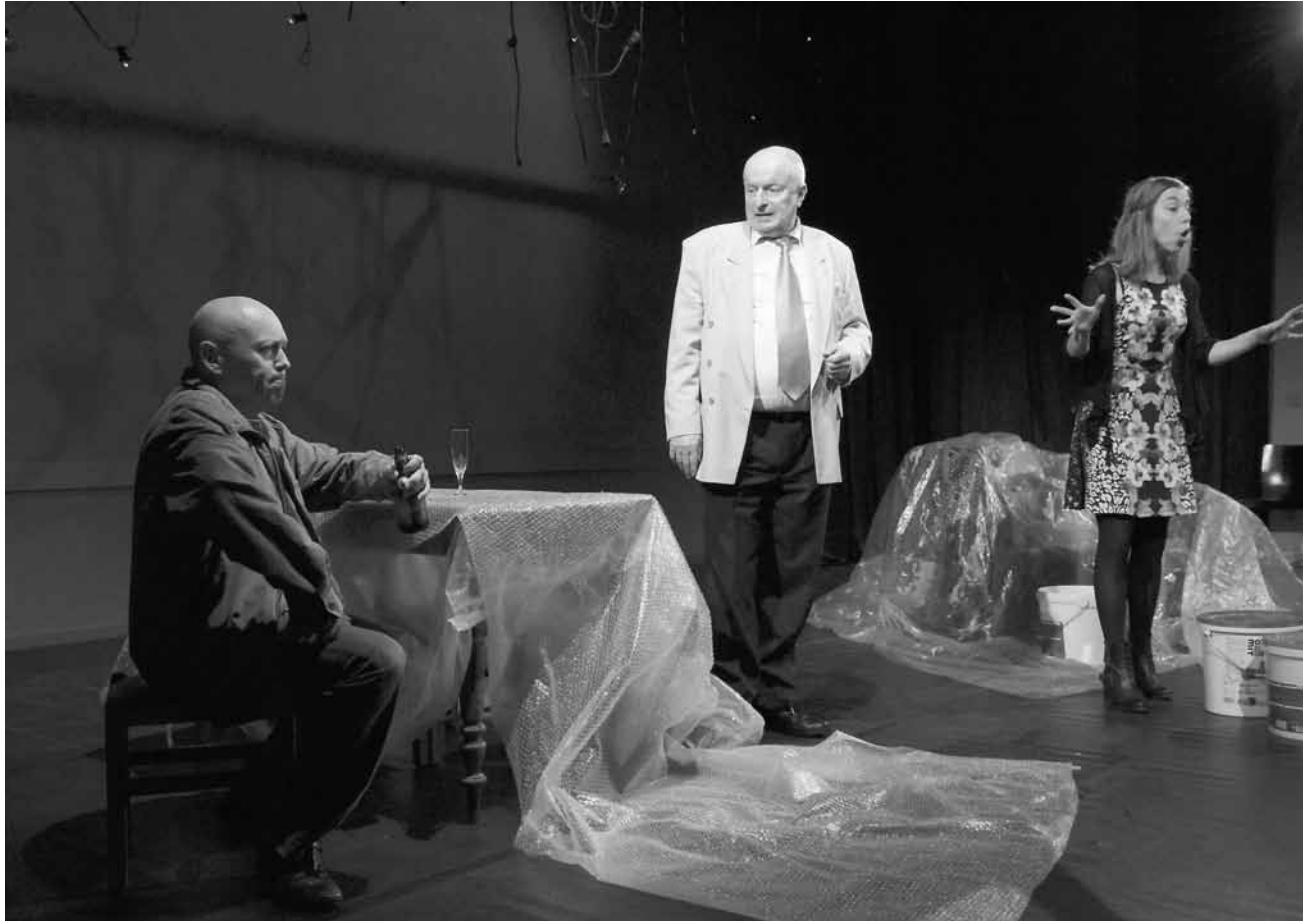
„De Wollef kennt heem“ spielt mit den Codes des Bauerntheaters, ist aber eine bitterböse Satire auf luxemburgische Kleingeistigkeit.