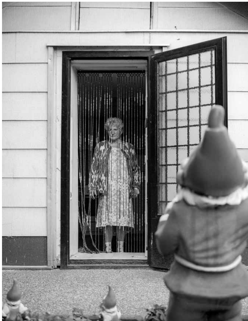
Der Schrebergarten als Mikrokosmos der Biedermann-Gesellschaft ist Thema des österreichischen Fotografen Klaus Pichler: „Middle Class Utopia“, im Garten des Bra'haus in Clerf, bis zum 4. Mai 2015.