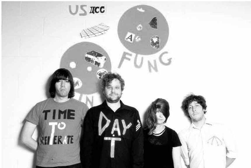
La Duchesse est leur mère supérieure et ils ne sont que ses messagers : « Duchess Says » célébreront leur messe de no-wave et de punk le 23 mai à l'Exit07.