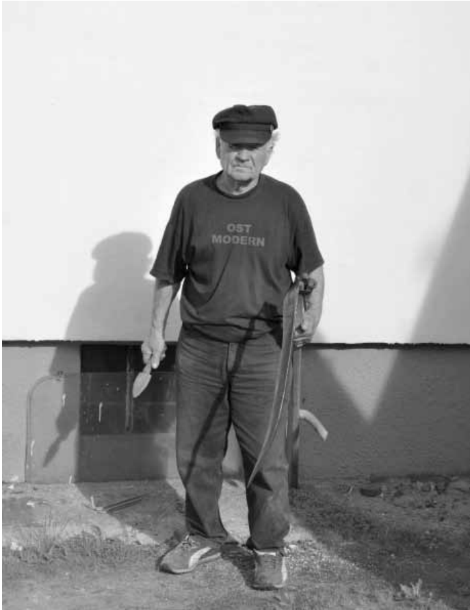
Le cauchemar de l'Européen de l'Ouest est de retour.