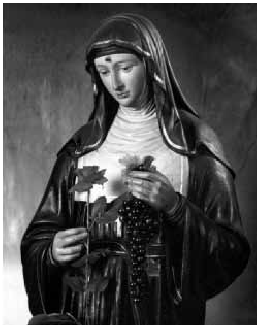
« Glorious Bodies » propose un dialogue sur l'iconographie entre deux artistes, Jacques Charlier et Sophie Langohr - issus de deux générations, - à l'Ikoba à Eupen, encore jusqu'au 13 juillet.