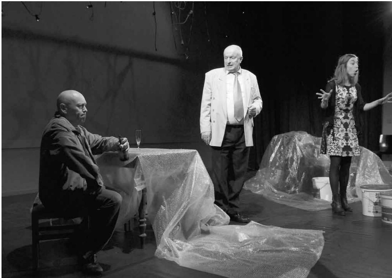
„De Wollef kennt heem“ spielt mit den Codes des Bauerntheaters, ist aber eine bitterböse Satire auf luxemburgische Kleingeistigkeit.