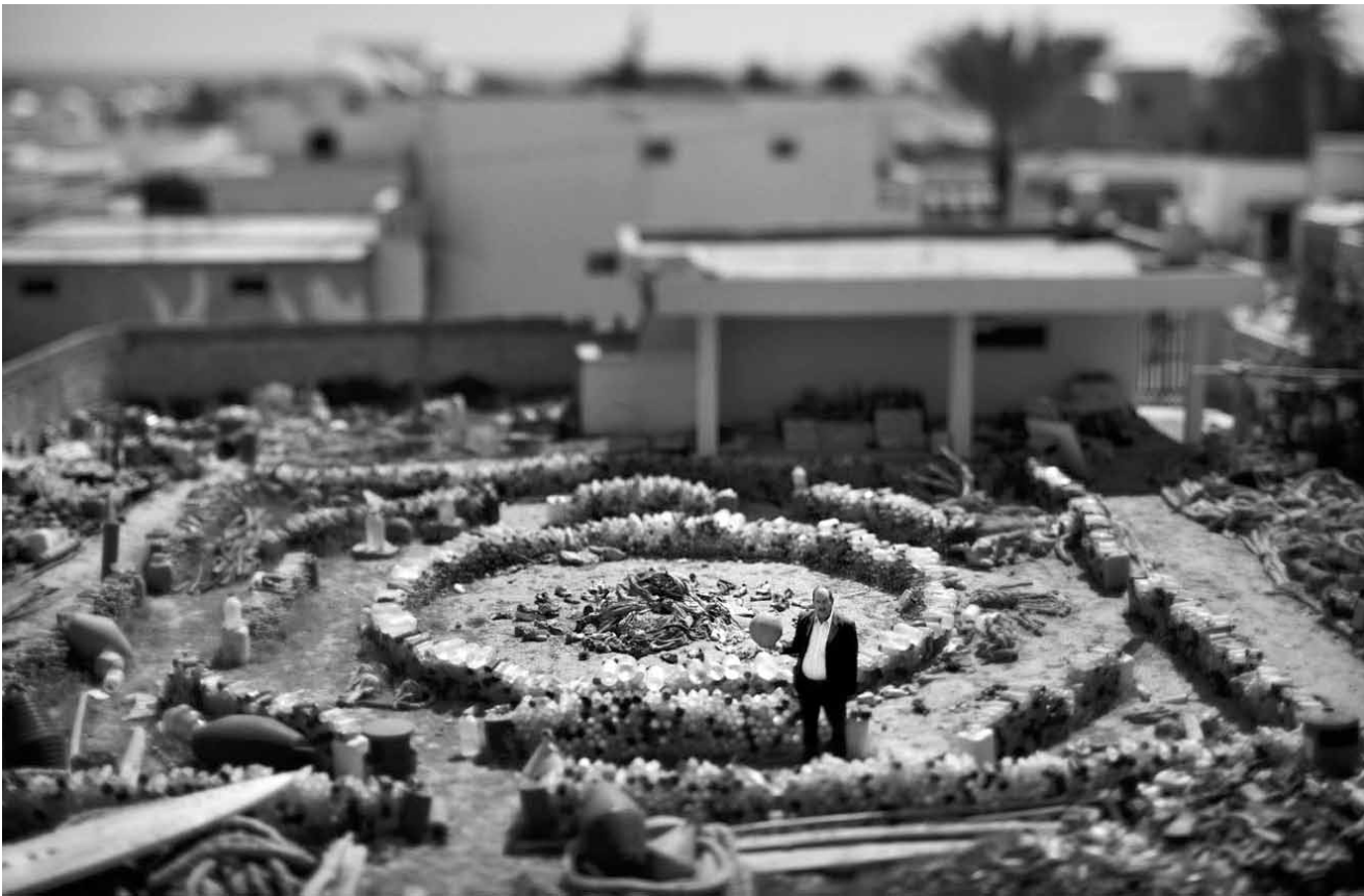
Les objets récupérés en mer par Mohsen Lihidheb constituent l'exposition « mémoire de la mer - objets migrants en Méditerranée » - du 8 mai au 27 juillet au Centre de documentation sur les migrations humaines à Dudelange.

NEW dessins et illustrations, Lycée des garçons, jusqu'au 7.6, lu. - ve. 14h - 17h.