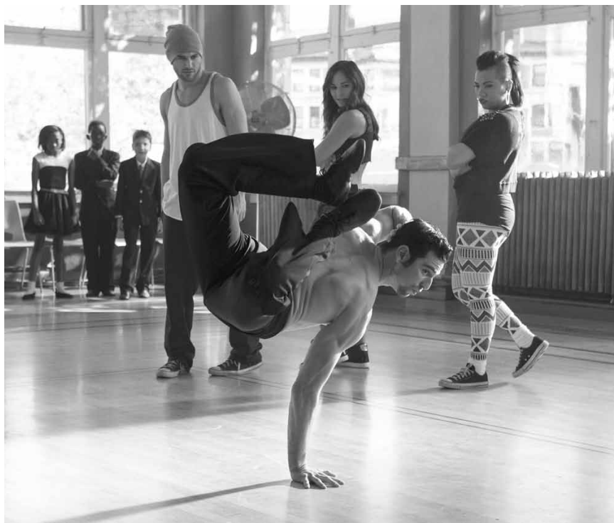
Tanzen bis der Arzt ansteppt - und das bereits zum sechsten Mal - „Step Up 6: All In“ - neu im Utopolis Belval und Kirchberg.

Kate aufgeklärt wird, weitet das Racheduo sich zum Trio aus.