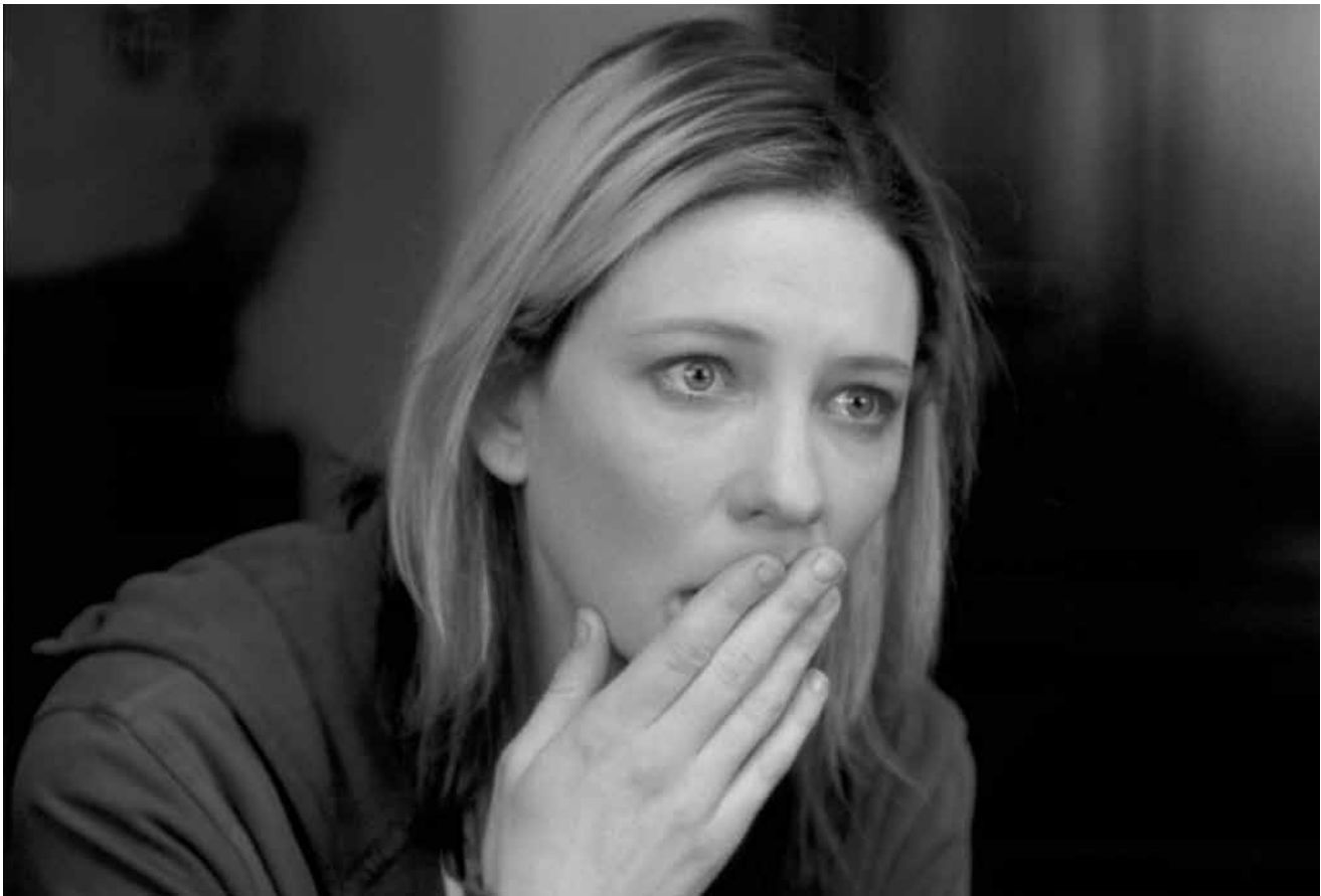
« Heaven » - l'histoire d'une revanche qui tourne court, par le metteur en scène de « Lola rennt », jeudi à la Cinémathèque.

GB 1957 de David Lean. Avec William Holden, Alec Guinness et Jack Hawkins. 160'. V.o., s.-t. fr. Version intégrale et restaurée en numérique.