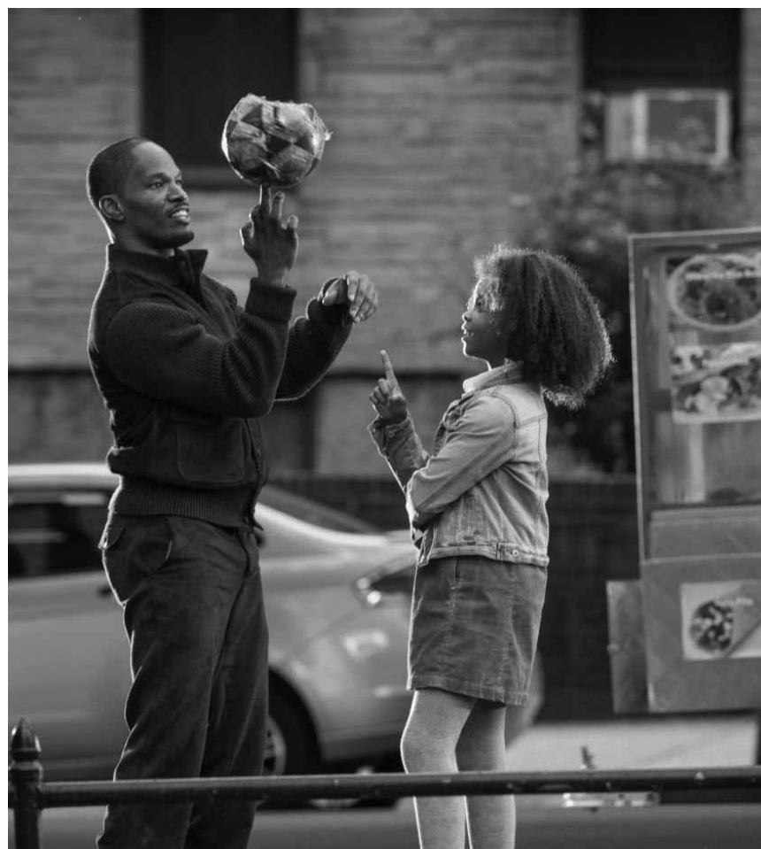
„Annie“ - oder das hässliche Entlein revisited als amerikanisches Weihnachtsmärchen, neu im Ariston, Ciné Waasserhaus und Kursaal.

Ballet von Peter Tschaikovsky. Choreographie von Yuri Grigorovich. 135', mit einer Pause. Live Übertragung aus dem Bolschoï Ballett, Moskau.