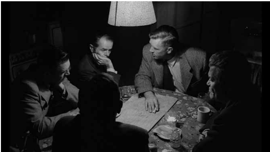
Un des films moins connus du maître Stanley Kubrick : « The Killing », le 15 janvier à la Cinémathèque.

Lolita UK 1962 de Stanley Kubrick. Avec James Mason, Shelley Winters, Peter Sellers et Sue Lyon. 149'. V.o., s.-t. fr. D'après le roman de Vladimir Nabokov. Mer, 7.1., 18h30.