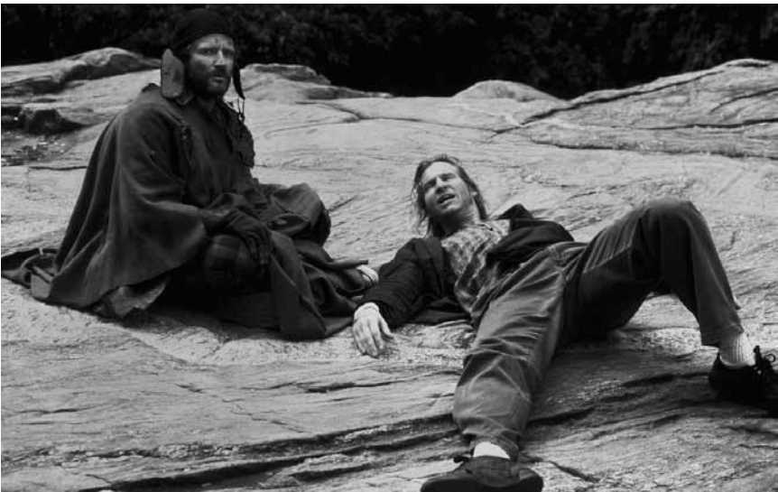
Une rencontre insolite transforme Central Park en cour des miracles : « The Fisher King », chef-d'oeuvre de Terry Gilliam à la Cinémathèque le 11 janvier.