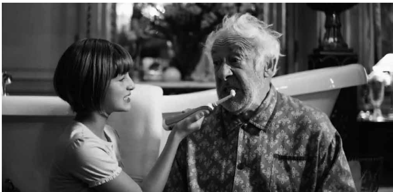
Pünktlich wie das Christkind: Til Schweigers neueste Schmonzette über das Älterwerden „Honig im Kopf“ - neu in den Kinos.

En Dokumetaire iwwer d'Liewen vum Grand-Duc Jean, mat Archivmaterial an deelweis nach ni gewisene Biller.