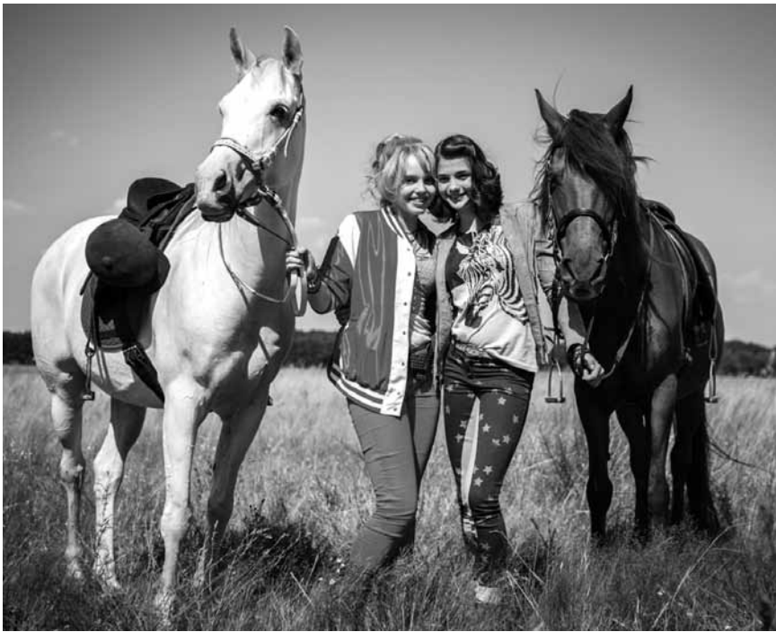
Wenns kein Pony zu Weihnachten gab, bleibt immer noch der Gang ins Kino: „Bibi und Tina“, neu in Utopia, Utopolis Belval und Kirchberg.

The Hobbit Marathon USA 2012 + 2013 + 2014 von Peter Jackson. Mit Ian McKellen, Martin Freeman und Richard Armitage. 169' + 161' + 145.' Ab 6. Dt. Fass.