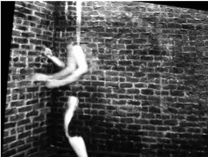
Femme presque invisible : «The Invisible Hero» de 2005.