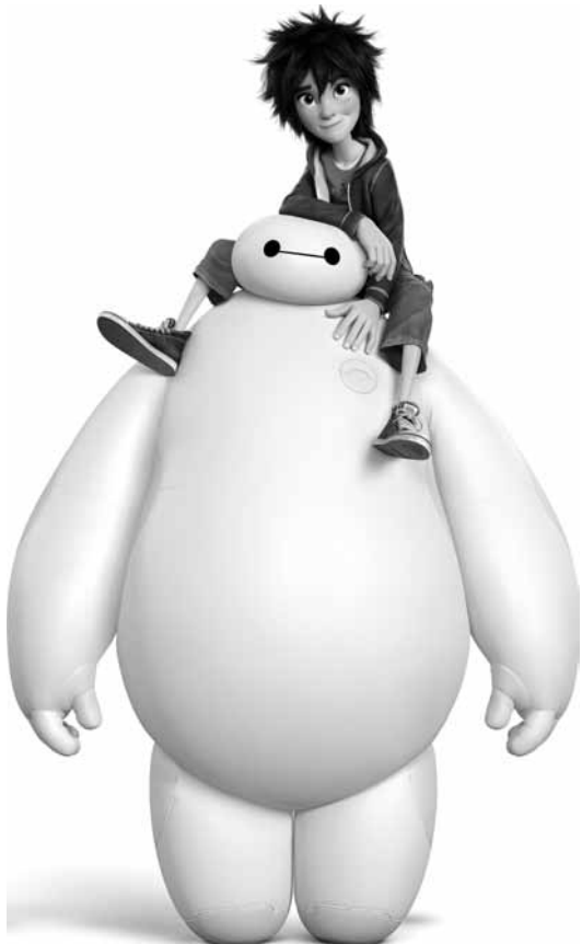
Aufblasbarer Roboter hilft Jugendlichen in einer nicht allzu fernen Zukunft: „Big Hero 6“ neu im Ariston, Ciné Ermesinde, Ciné Waasserhaus, Kursaal, Prabbeli, Scala, Starlight, Sura, Utopolis Belval und Kirchberg