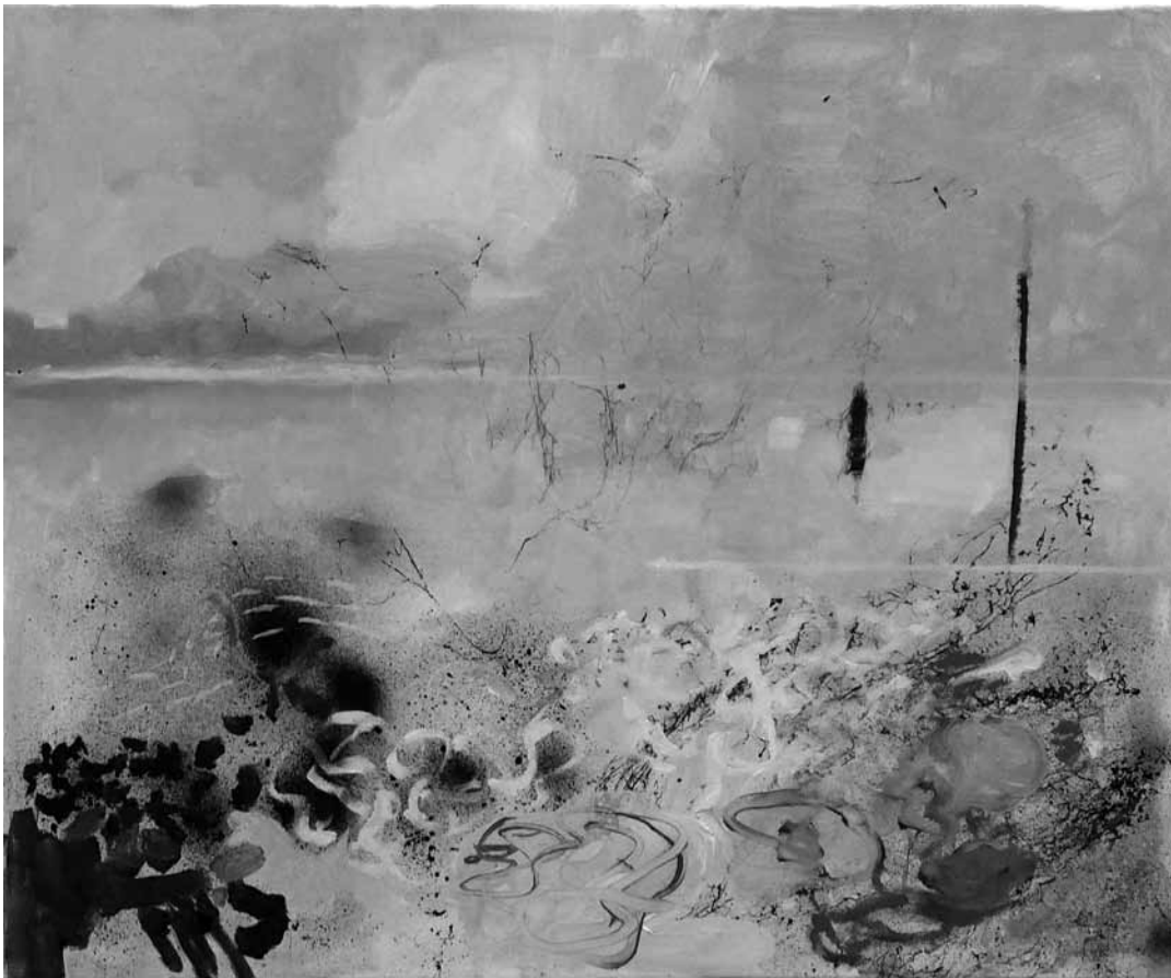
« Shore to Shore » - un voyage dans l'intimité de l'artiste.