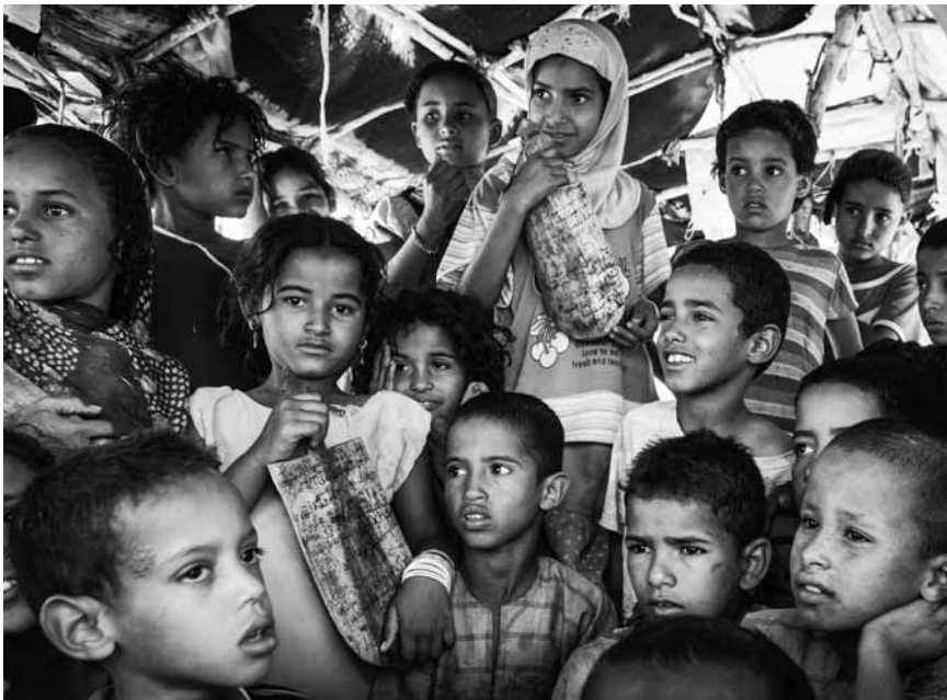
Vincent Cardillo expose les visages de la migration : « De sable et de vent », dans le cadre du Festival des migrations, ces vendredi, samedi et dimanche à Luxexpo.

Musée national de la Résistance (place de la Résistance, tél. 54 84 72), Esch-sur-Alzette, ma. - di. 14h - 18h.