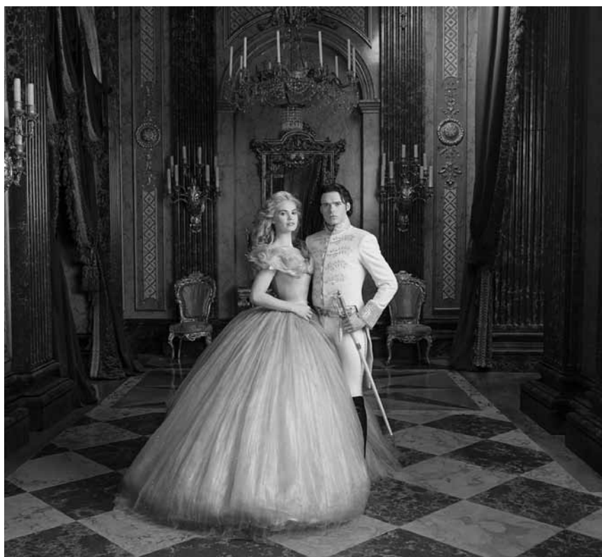
Dieses Foto könnte glatt aus einem Sissy-Remake stammen: „Cinderella“ - nicht wirklich zeitgenössisch aufbereitet von Kenneth Branagh. Neu in den Kinos.

Robotern, sogenannten Scouts, die kompromisslos für „Recht und Ordnung“ sorgen. Doch die Menschen wehren sich bald gegen diese Art von „Schutz“. Eines Tages wird einer dieser Polizei-Droiden gestohlen und neu programmiert. Chappie entwickelt daraufhin als erster Roboter die Fähigkeit, eigenständig zu denken und zu fühlen. Doch die mächtige Elite sieht so einen Roboter überhaupt nicht gern und versteht ihn nicht nur als Bedrohung für die öffentliche Ordnung, sondern gar als Gefahr für die gesamte Menschheit. Voir filmtipp