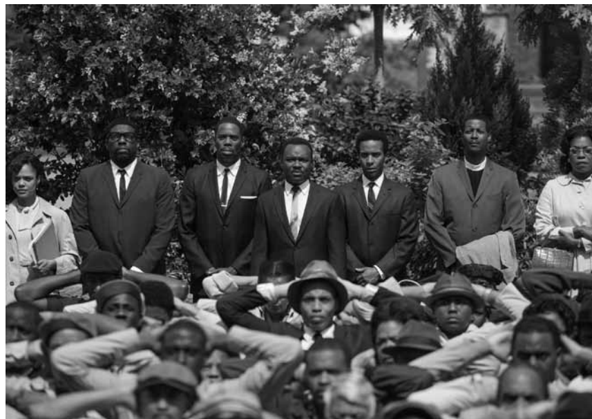
„I have a Dream!“ Ava DuVernays' Biopic „Selma“ lässt die tragischen Ereignisse von vor fünfzig Jahren in Alabama wiederaufleben. Neu im Utopolis Kirchberg.

Florence et Vincent Leroy ont tout réussi. Leurs métiers, leur mariage, leurs enfants. Et aujourd'hui, c'est leur divorce qu'ils veulent réussir. Mais quand ils reçoivent simultanément la promotion dont ils ont toujours rêvé, leur vie de couple vire au cauchemar. Dès lors, plus de quartier, les ex-époux modèles se déclarent la guerre : et ils vont tout faire pour ne pas avoir la garde des enfants.