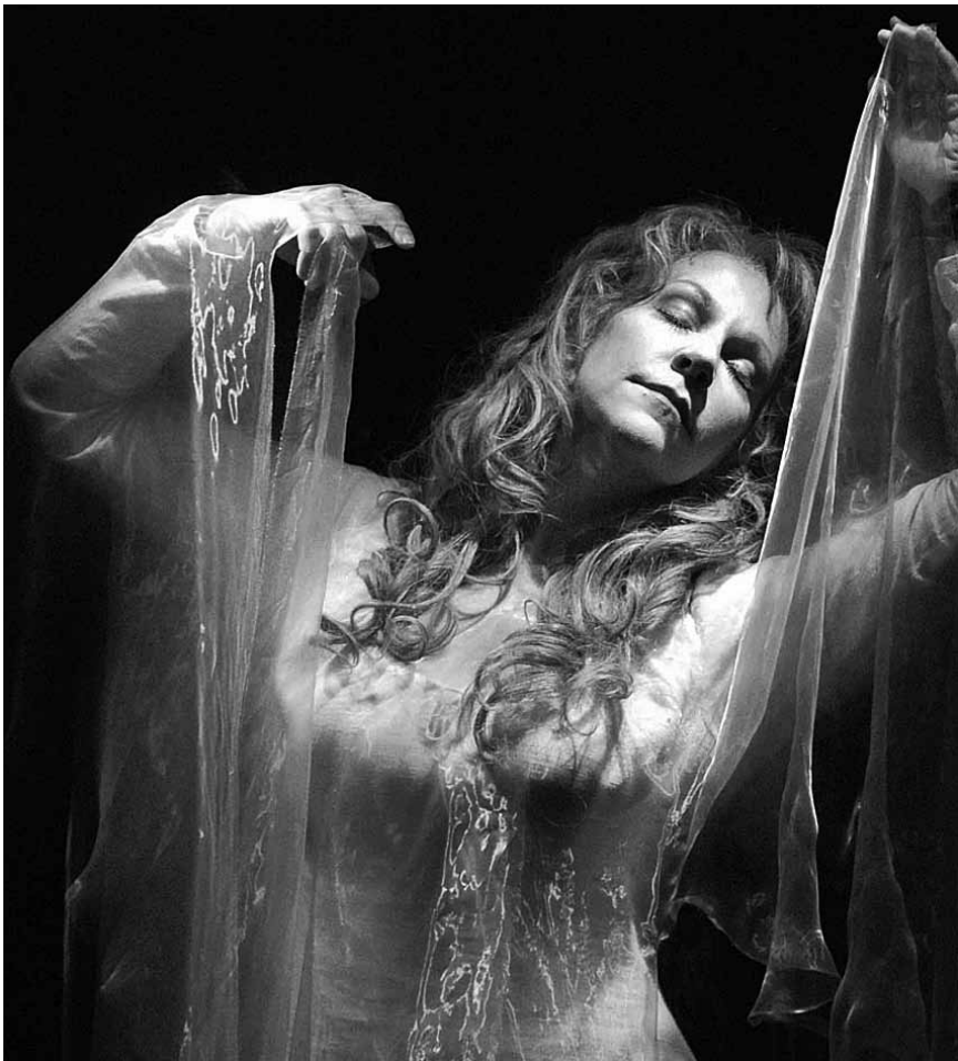
Du romantisme en deux actes sur grand écran : l'opéra de Rossini « La donna del lago » à l'Utopia et aux Utopolis Belval et Kirchberg.

Swan Lake Chorégraphie de Marius Petipa et Lev Ivanov sur la musique de Piotr Tchaïkovski. 180', deux entractes. En direct du Royal Opera House, Londres.