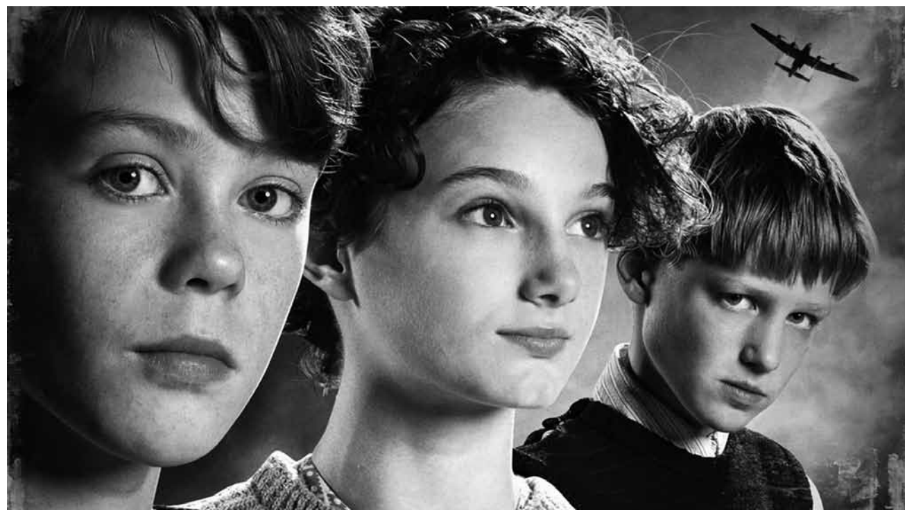
How war is lived through the eyes of kids: "Oorlogsgeheimen - Secrets of War" - which was awarded at the Luxembourg City Film Festival - tries to find an answer to this interesting issue - new at Utopolis Kirchberg and Belval.

Der brillante Mathematiker Alan Turing gehört zu den führenden Denkern des Landes, besonders was