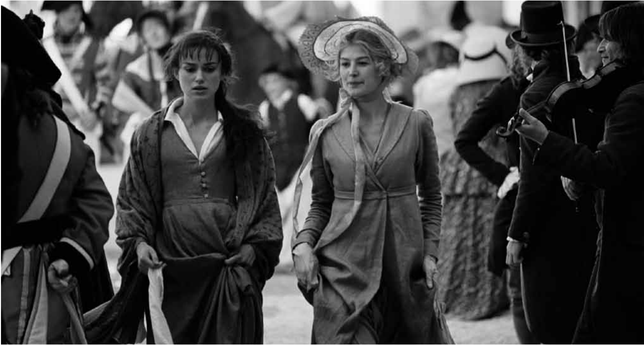
Le roman de Jane Austen sur cinq sœurs du début du 19e siècle dans la version de Joe Wright : « Pride and Prejudice », samedi à la Cinémathèque.

Trois parapsychologues perdent de manière abrupte leur emploi à l'université de New York. Se recyclant d'urgence dans le secteur privé, ils fondent l'agence « SOS Fantômes », capable de venir mater les spectres les plus rebelles.