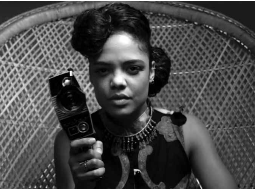
Une confrontation satirique sur fond de racisme... et une parodie de l'ère Obama : « Dear White People », nouveau à l'Utopia.