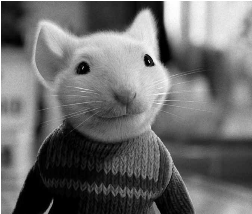
Même la Cinémathèque se tourne vers le grand écran pour les tout-petits : « Stuart Little » passera ce dimanche après-midi.

USA 1986 de Michael Mann. Avec William Petersen, Kim Greist et Joan Allen. 119'. V.o., s.-t. fr.