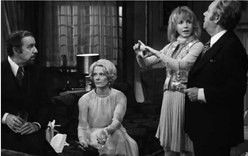
Et encore un film de Luis Buñuel qui n'est pas passé inaperçu à l'époque : « Le charme discret de la bourgeoisie », mardi à la Cinémathèque.

Pour une affaire criminelle particulièrement trouble, un célèbre