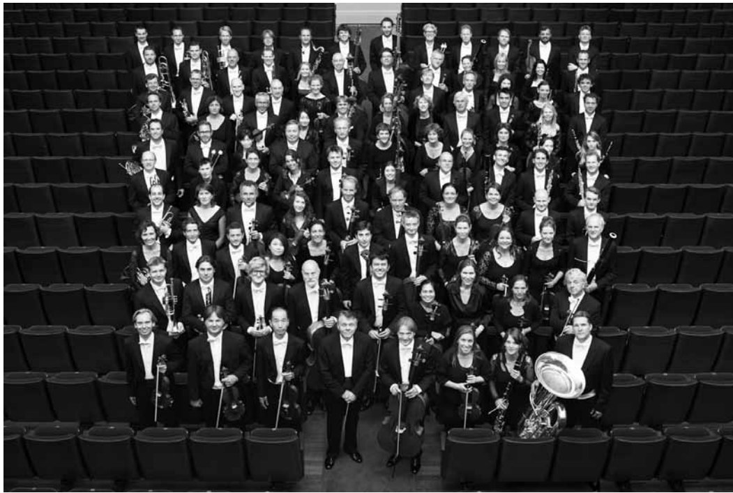
Royal Concertgebouw Orchestra Amsterdam