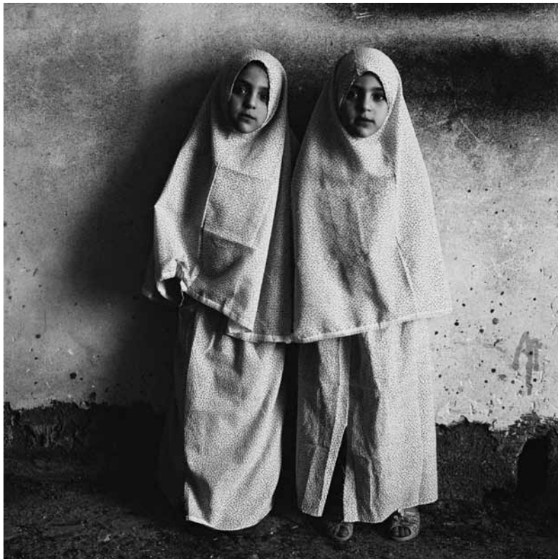
Alltag im Westjordanland.