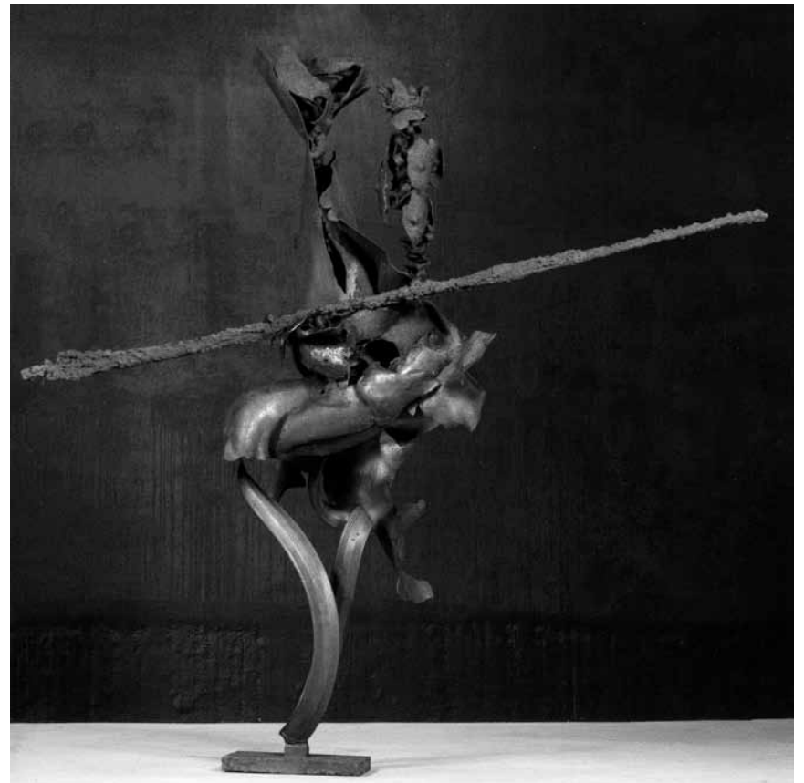
L'artiste Albert Haas, décédé en 1984 a droit à une rétrospective à l'espace H2O à Oberkorn, du 22 avril au 31 mai.

itinéraire en images des voyages des souverains luxembourgeois empereurs du Saint-Empire romain germanique au Moyen Âge, église, jusqu'au 3.5, tous les jours 10h - 17h (excepté pendant les services religieux).