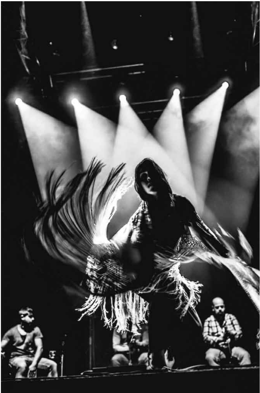
La musique et la danse en mouvement : « iFlamenco! », à la Kulturfabrik jusqu'au 16 mai.

Musée national de la Résistance (place de la Résistance, tél. 54 84 72), Esch-sur-Alzette, ma. - di. 14h - 18h. Musée national d'histoire naturelle (25, rue Münster, tél. 46 22 33-1), Luxembourg, ma. - di. 10h - 18h. Musée national d'histoire et d'art (Marché-aux-Poissons, tél. 47 93 30-1), Luxembourg, ma., me., ve. - di. 10h - 18h, je. nocturne jusqu'à 20h. Musée d'histoire de la Ville de Luxembourg (14, rue du St-Esprit, tél. 47 96 45 00), Luxembourg, lu., me., ve. - di. 10h - 18h, je. nocturne jusqu'à 20h. Musée d'art moderne Grand-Duc Jean (parc Dräi Eechelen, tél. 45 37 85-1), Luxembourg, me. - ve. 11h - 20h, sa - lu. 11h - 18h. Musée Dräi Eechelen (parc Dräi Eechelen, tél. 26 43 35), Luxembourg, lu., je. - di. 10h - 18h, me. nocturne jusqu'à 20h. Villa Vauban - Musée d'art de la Ville de Luxembourg (18, av. Emile Reuter, tél. 47 96 49 00), Luxembourg, lu., me., je., sa. + di. 10h - 18h, ve. nocturne jusqu'à 21h. The Bitter Years (château d'eau, 1b, rue du Centenaire, tél. 52 24 24-303), Dudelange, me., ve. - di. 12h - 18h, je. nocturne jusqu'à 22h. The Family of Man (montée du Château, tél. 92 96 57), Clervaux, me. - di. + jours fériés 12h - 18h.