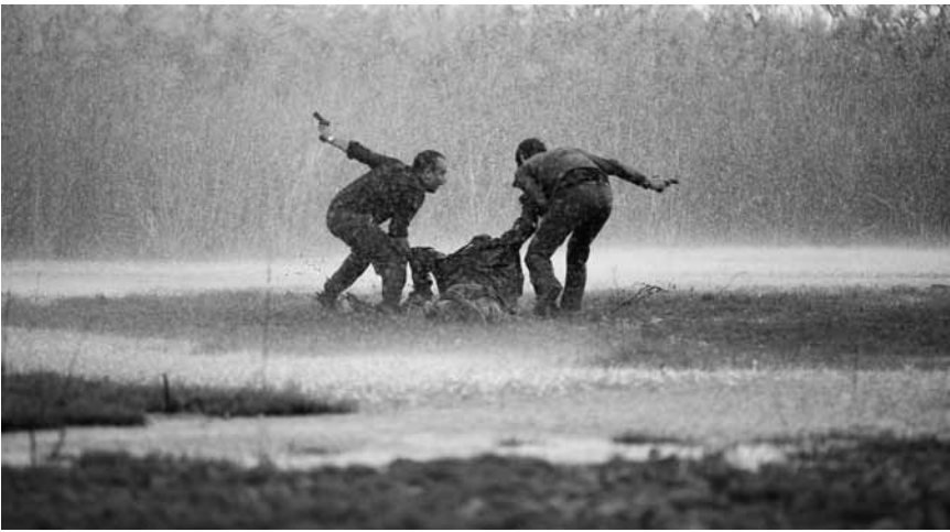
« La isla mínima » a pour fond de scène une Espagne déchirée par des décennies de dictature fasciste, où des enquêteurs ennemis doivent traquer un assassin sauvage - nouveau à l'Utopia.

USA/F 2015, Animationsfilm von Mark Burton und Richard Starzack. 85'. Ohne Worte. Für alle.