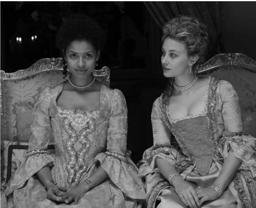
„Belle“ versetzt den Rassenkonflikt in die obersten Schichten des viktorianischen Establishments - zu sehen im Utopia im Rahmen der „Summer Follies“.