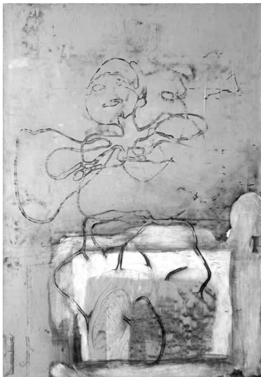
Entre graffiti, graphisme, street art et mise à nu poétique, l'artiste belge Franca Ravet donne rendez-vous à la galerie Schortgen du 19 septembre au 15 octobre.

installation, Cecil's Box (4e vitrine du Cercle Cité, côté rue du Curé), jusqu'au 4.10, en permanence