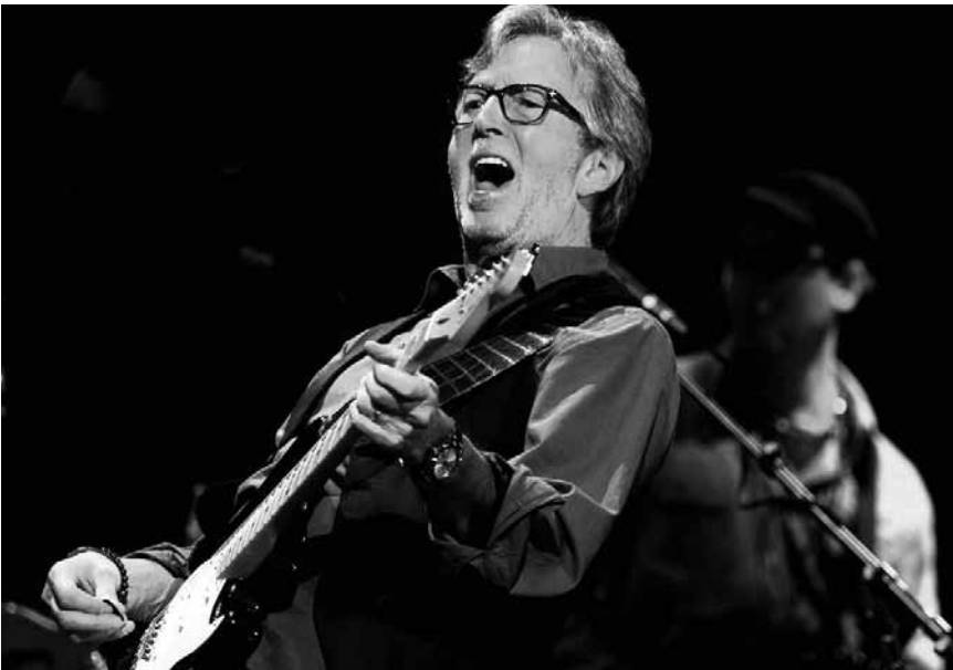
British rock icon Eric Clapton had one of his 70th birthday celebration tour concerts recorded - fans in Luxembourg will be able to watch it on Tuesday Oct. 27th at the Utopia.