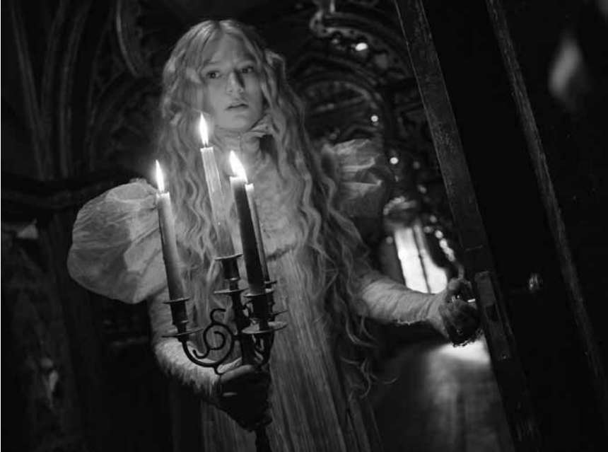
In Guillermo del Toros „Crimson Peak“ hat Übersinnliches Konjunktur: Mia Wasikowska wird wohl mehr Geistern begegnen als ihr lieb ist.

La police est à la recherche d'un jeune homme porté disparu, Martim. Pourquoi a-t-il quitté sa maison et où est-il ?