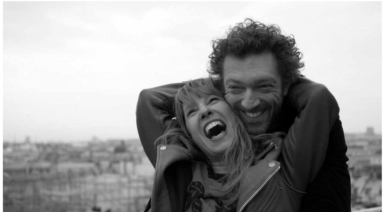
Une image trop belle pour être vraie : Dans « Mon roi », Maïwenn étudie la relation amoureuse d'un couple de bourgeois à la loupe. Nouveau à l'Utopia.

✖ La poésie de J. M. Barrie est diluée dans les trop nombreux combats, les décors 3D et la superficialité des