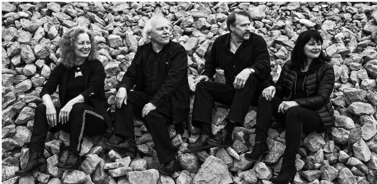
Vun dësem Freiden un ass et nees souwäit : De Cabarenert spillt am Neimënster - bal all Owend gött eist Land aus der Perspektiv vum Joer 2023 kräfteg op d'Schëpp geholl.

2. Kammerkonzert , Werke von Piazzolla und Gardel, Mittelfoyer im Saarländischen Staatstheater,