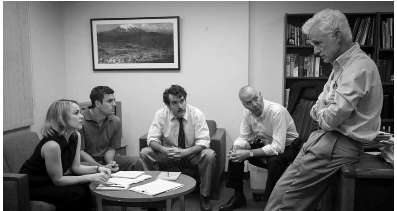
Pädophile Priester, neugierige Journalisten und ein handfester Skandal: Die Zutaten von „Spotlight“ sind explosiv - neu im Utopolis Kirchberg.

NEW USA 2015 von Danny Boyle. Mit Michael Fassbender, Kate Winslet