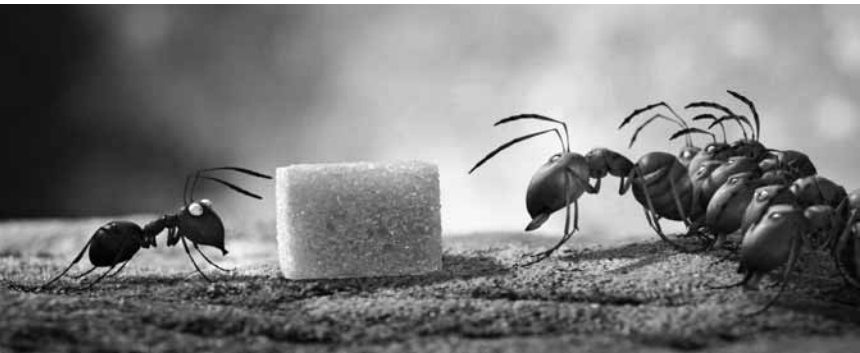
La guerre froide autour d'un pique-nique : dans « Minuscule », les fourmis noires doivent affronter leurs collègues rouges - aux Utopolis Belval et Kirchberg.

Bon voyage, Dimitri F/RU 2014, courts métrages sans paroles pour enfants de Natalia Chernysheva, Fabrien Drouet, Mohamed Fadera, Sami Guellaï, Agnès Lecreux et Olesya Shchukina. 44'.