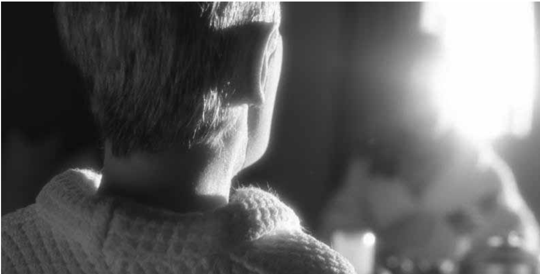
Charlie Kaufmans neuester Held muss sich in einer gesichtslosen Welt herumschlagen.