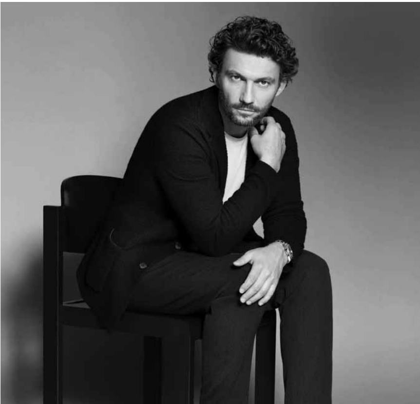
Last June the tenor Jonas Kauffmann had the public of the Scala of Milan at his feet - the concert "An Evening with Puccini" is shown this week at Utopia.