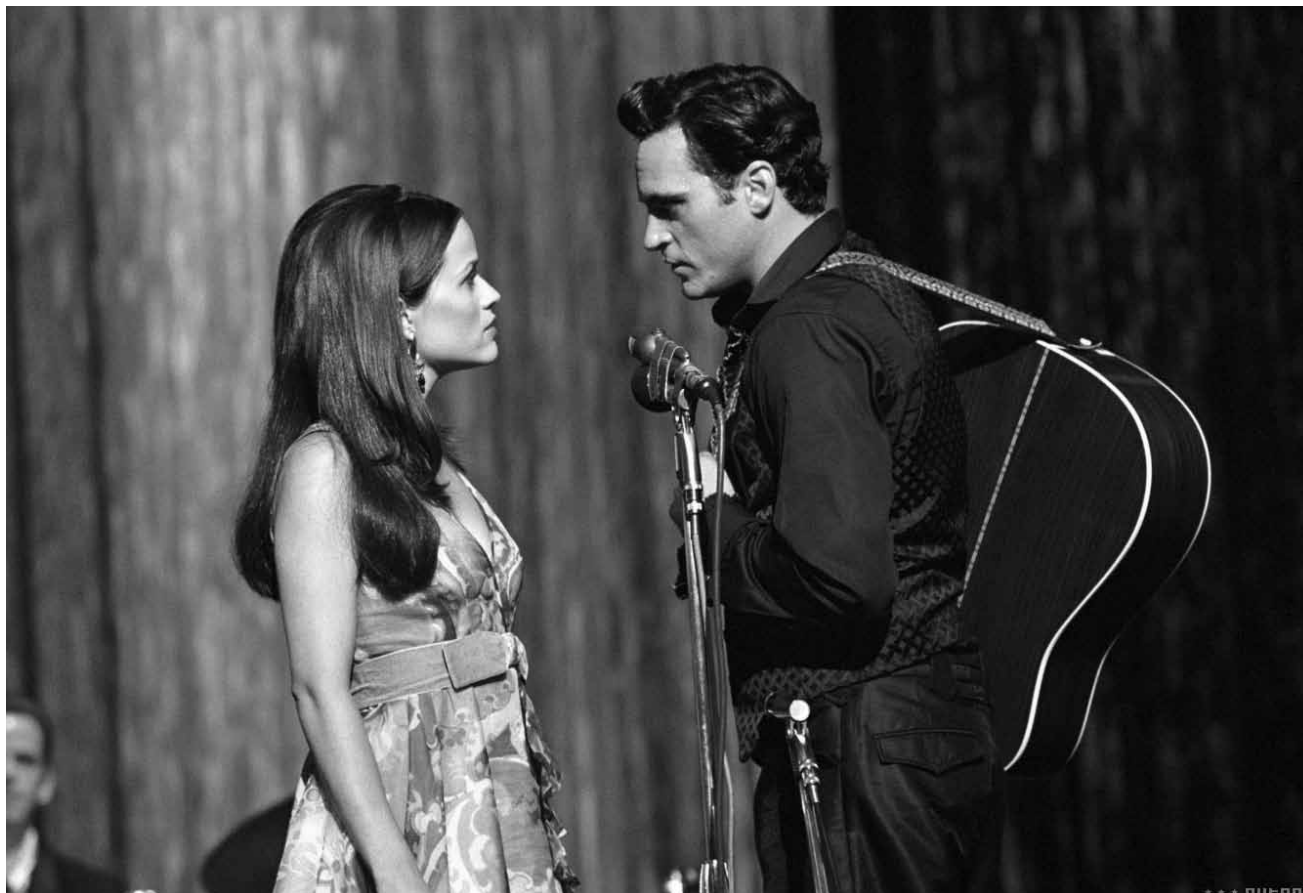
Wurde mit einem Oscar für die beste weibliche Nebenrolle gewürdigt: Reese Witherspoon in „Walk the Line“ von James Mangold, an diesem Sonntag in der Cinémathèque.

Zootopia, eine gigantische Stadt voller Möglichkeiten: Hier leben die unterschiedlichsten Tierarten Seite an Seite. Mitten in den Trubel dieser Großstadt wird die junge Polizistin Judy Hopps versetzt, die hofft, nun endlich einmal einen großen Fall lösen zu dürfen. Aber als kleiner Nager zwischen lauter großgewachsenen Kollegen wird sie nur belächelt und so darf Judy lediglich Parksündern nachjagen. Als ihr Chef sie endlich mit einem spannenden Auftrag betraut, stellt die clevere Kaninchen schnell fest, dass sie Hilfe braucht.