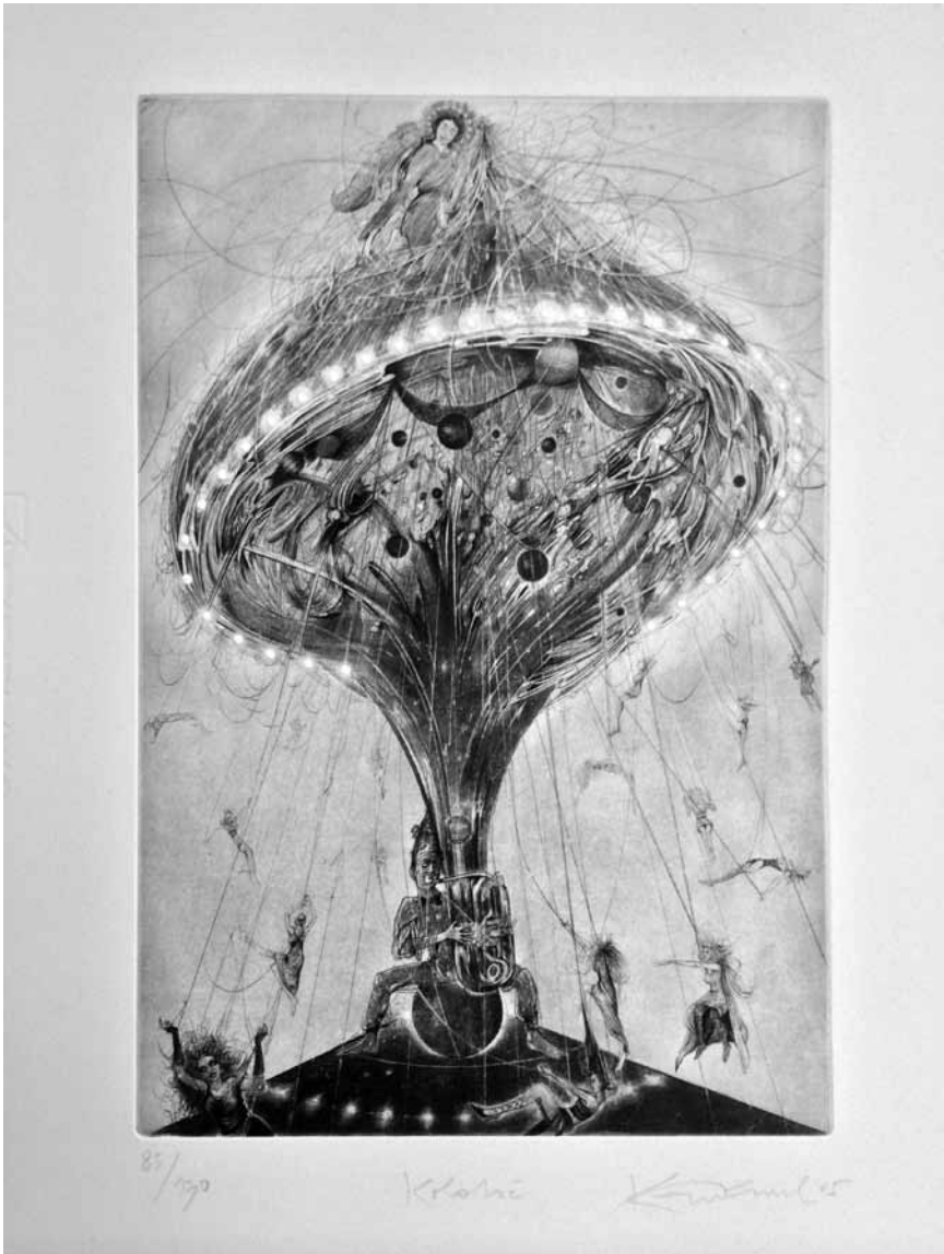
C'est grave docteur ? - Non, mais c'est beau : « Univers de graveurs » exposition collective, du 15 avril au 8 mai à la Millegalerie à Beckerich.

(place de la Résistance, tél. 54 84 72), Esch-sur-Alzette, ma. - di. 14h - 18h.