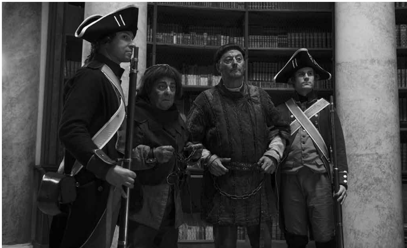
Ils hantent toujours les couloirs spatio-temporaux - et les salles obscures - dans « Les visiteurs 3 » Godefroy de Montmirail et son Jacquouille débarquent pendant la Révolution française - nouveau au Ciné Ermesinde, Ciné Waasserhaus, Kursaal, Utopolis Belval et Kirchberg.

Vermählung von Toula und Ian Miller vergangen, die beiden immer noch ein Paar. Wobei es im Arbeits- und Familienalltag gar nicht so leicht ist, die Beziehung frei von Ärger zu halten - woran nicht zuletzt ihre Teenager-Tochter Paris Schuld ist, die es in die Ferne zieht.