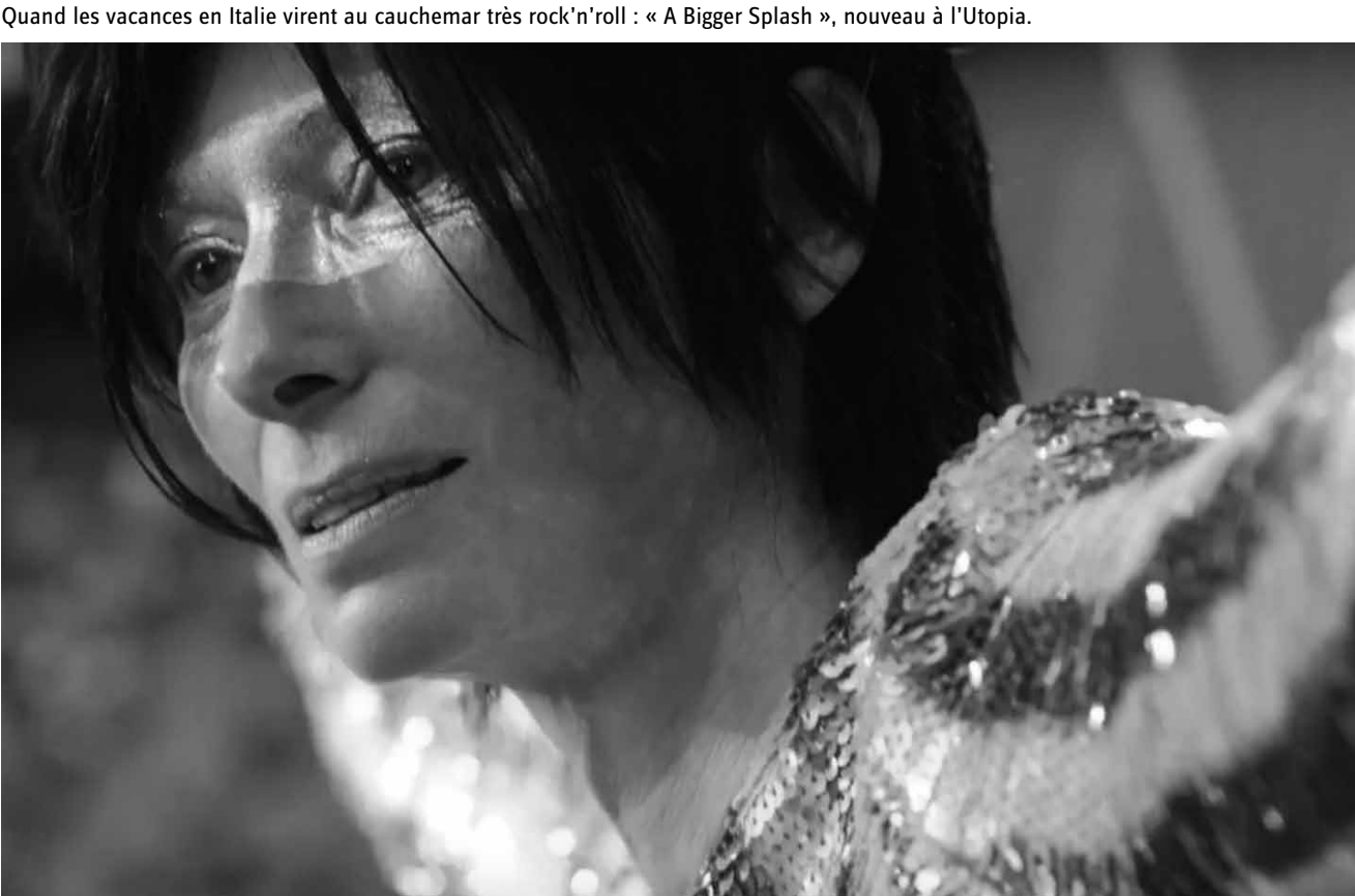
Quand les vacances en Italie virent au cauchemar très rock'n'roll : « A Bigger Splash », nouveau à l'Utopia.

Die junge Irin Eilis lässt in den frühen 1950er Jahren Heimat und Familie hinter sich, um in New York die Chance auf ein besseres Leben zu ergreifen. In Brooklyn findet sie eine Anstellung in einem Modegeschäft und lernt auf einem irischen Tanzfest den italienischstämmigen Amerikaner Tony kennen, der ihr hilft, sich in der Großstadt einzuleben. Zwischen den beiden entwickelt sich trotz der Vorbehalte von Tonys Familie eine intensive Liebesbeziehung, die