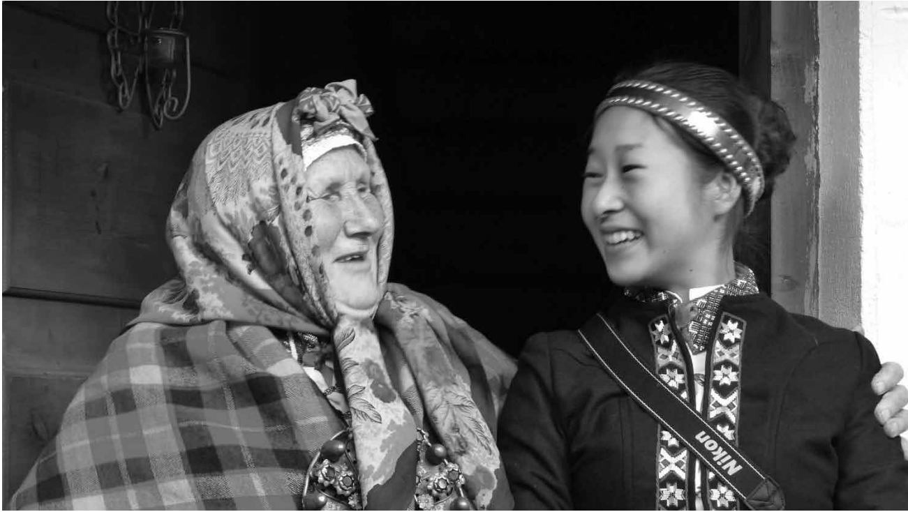
"Ruch & Norie" - a documentary by Inara Kolmane tells the extraordinary story of the friendship between a young Japanese student and a 82-year-old woman belonging to the Sui community in Latvia - Friday, April 15th at the Cinémathèque.