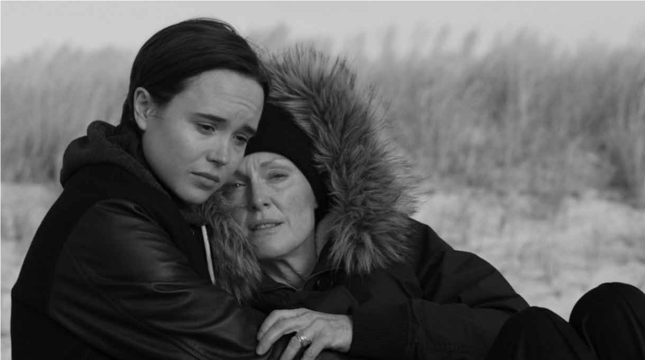
Noch mehr Witwen: In „Freeheld“ kämpft ein lesbisches Paar um seine Pensionsansprüche - neu im Utopia.

Also ist es an Po, aus seinen gemütlichen Verwandten mutige, selbstsichere Kämpfer zu machen.