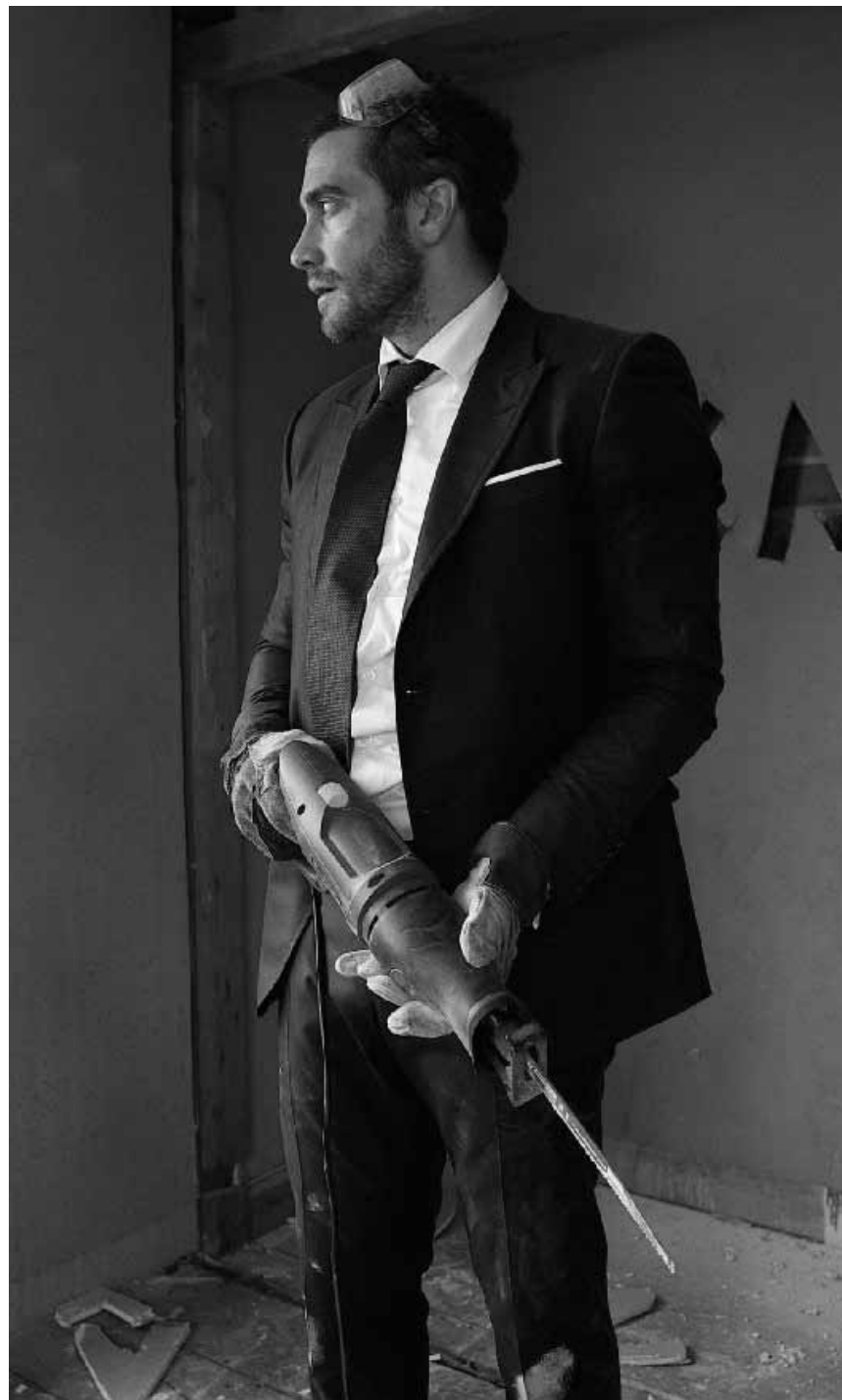
In „Demolition“ muss ein frisch verwitweter Investmentbanker den Sinn des Lebens wiederentdecken - neu im Utopolis Kirchberg.

Das Leben des jungen und erfolgreichen Investmentbankers Davis Mitchell wird in seinen Grundfesten erschüttert, als seine Ehefrau bei dem Verkehrsunfall, bei dem er nur leicht verletzt wurde, ums Leben kommt. Er beginnt, sein bisheriges Leben, die Gesellschaft und den amerikanischen und konstitutionell verbrieften Geist des "Pursuit of Happiness" zu hinterfragen. Die Bekanntschaft mit Karen Mareno und ihrem Sohn Chris rüttelt Davis gehörig auf und eröffnet die Chance auf einen Neuanfang - auch wenn das bedeutet,