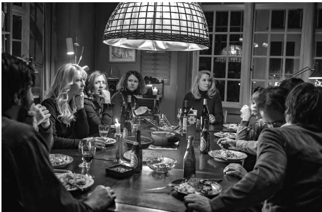
Die Geschichte vom Aufbau und Niedergang einer Kommune steht im Zentrum des neuen Films von Thomas Vinterberg: „Kollektivet“ - neu im Utopia.

de Laâge était un peu plus expressif. Les actrices polonaises, elles, incarnent parfaitement le tiraillement entre foi et désir de maternité. (ft)