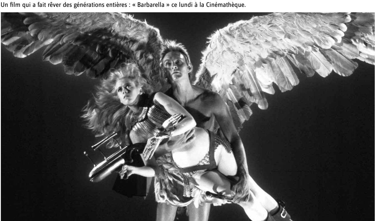
Un film qui a fait rêver des générations entières : « Barbarella » ce lundi à la Cinémathèque.