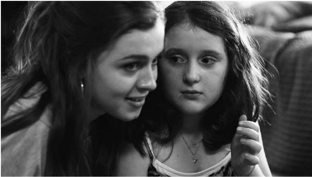
Deux sœurs durement mises à l'épreuve.