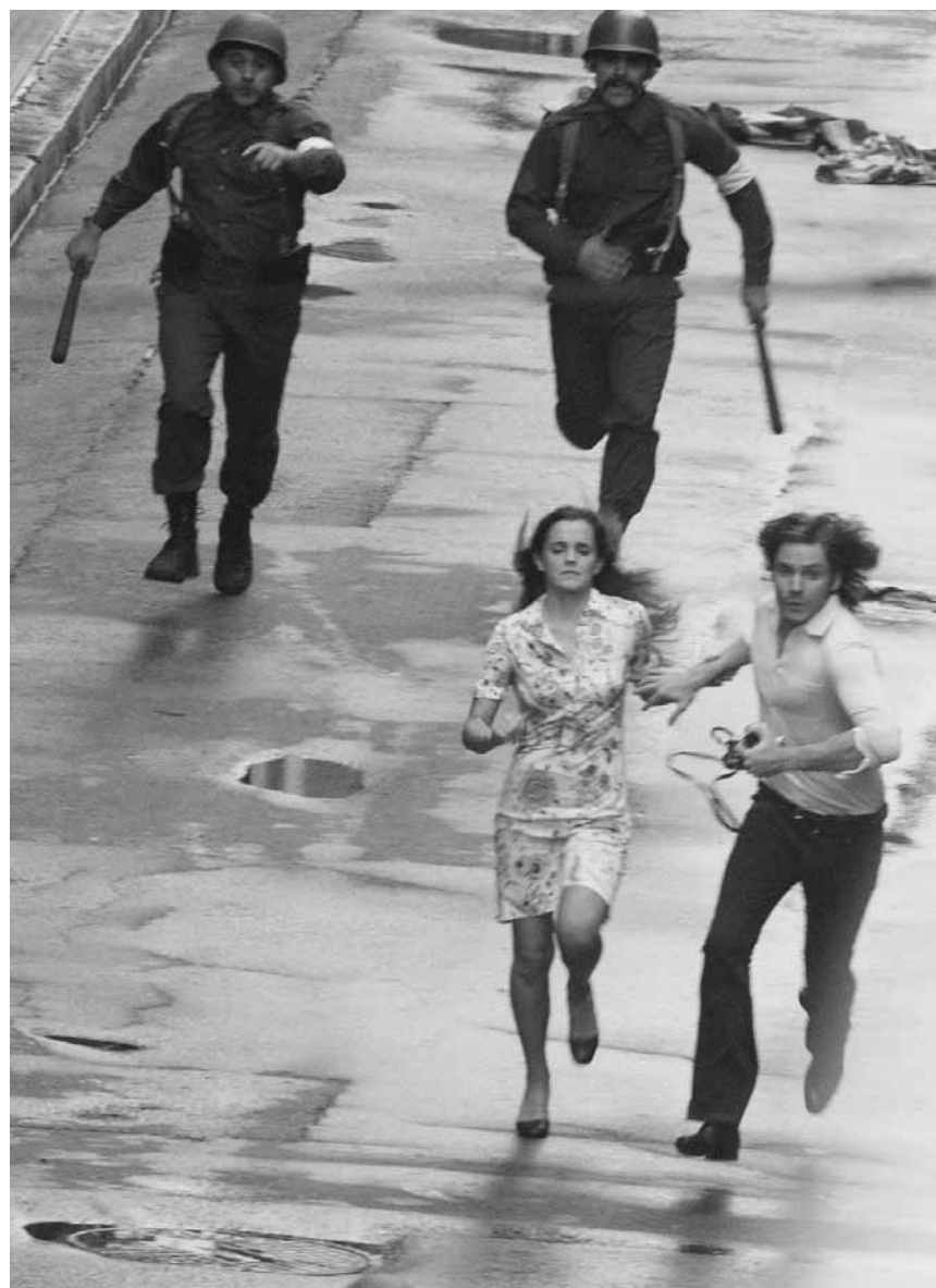
Deutscher Kulturexport at its very worst: „Colonia“ - im Le Paris, Orion, Prabbeli, Starlight, Sura und Utopia.

D 2015 von Lars Kraume. Mit Burghart Klaußner, Ronald Zehrfeld und Lilith Stangenberg. 106'. O.-Ton. Ab 12.