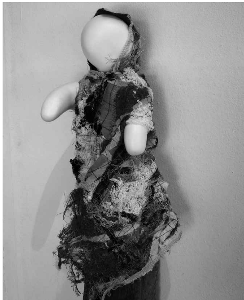
Les « K-Dolls in House » envahissent l'espace Beau Site d'Arlon, et en plus c'est pour la bonne cause - à voir jusqu'au 26 juin.