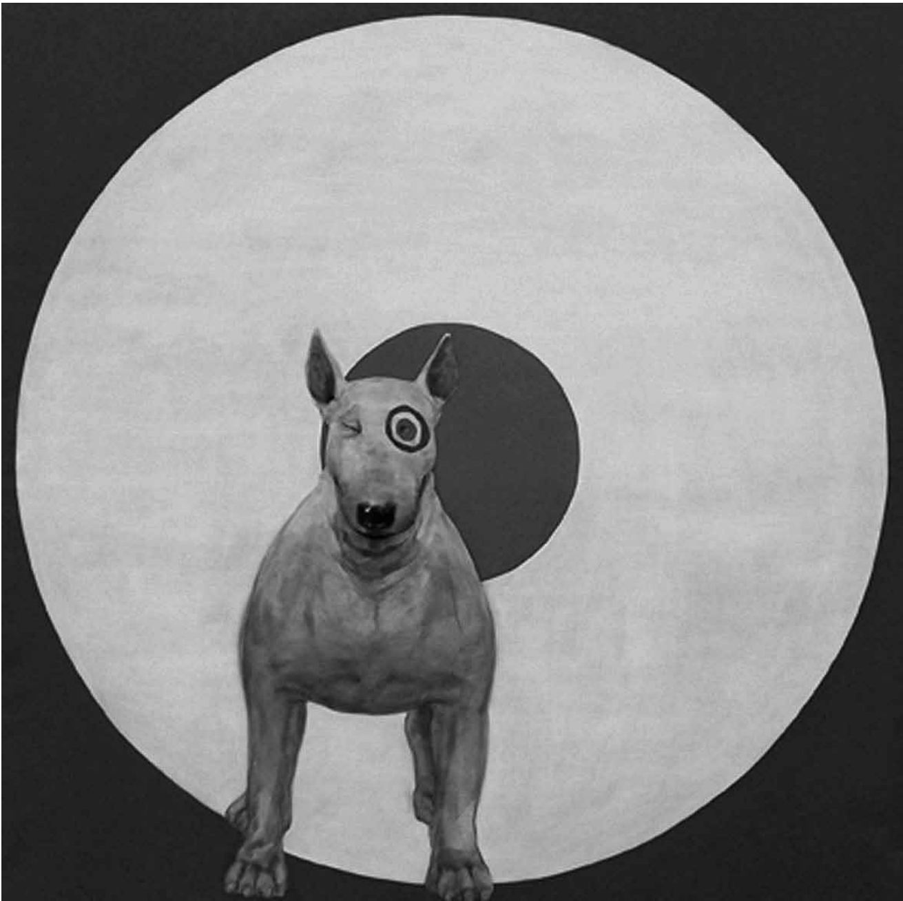
Et voilà, notre quota de chiens par numéro est atteint ! Grâce à Ray Richardson, le « Scorsese de la peinture », dont l'exposition « The Outer Limits » sera à la galerie Clairefontaine (espace 1) jusqu'au 23 juillet.

peintures et dessins, Musée national d'histoire et d'art (Marché-aux- Poissons, tél. 47 93 30-1), jusqu'au 26.6, ma., me., ve. - di. 10h - 18h, je. nocturne jusqu'à 20h.