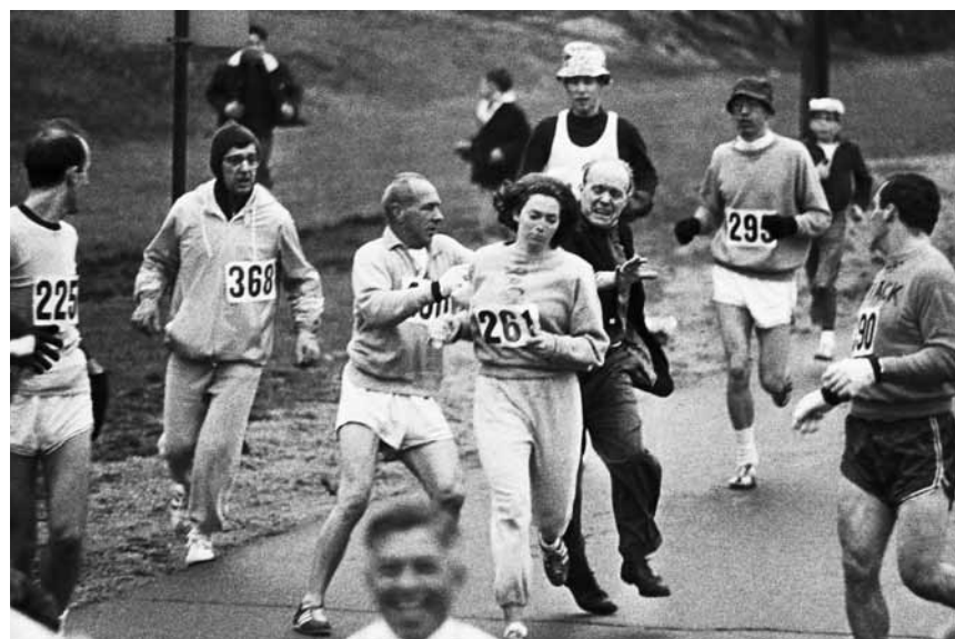
« Free to Run » retrace l'histoire mouvementée de la popularisation de la course à pied - nouveau à l'Utopia.