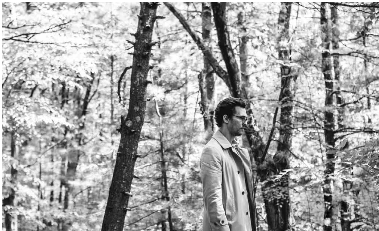
Gus Van Sant's neuestes Werk, „The Sea of Trees“, ist bei vielen Kritikern durchgefallen - vielleicht ein Grund mehr es sich anzusehen? Neu im Utopia.

Seit seiner Kindheit träumt der Brite Michael „Eddie“ Edwards davon, einmal an den Olympischen Spielen teilzunehmen. Ende der 1980er Jahre wird sein Interesse für das Skispringen geweckt, dem er sich trotz fehlender Erfahrung intensiv widmet. Um sich gebührend auf eine mögliche Olympia-Teilnahme vorzubereiten, nimmt er an einigen internationalen Wettbewerben teil, bei denen er schließlich auch das Ex-Ski-Ass Bronson Peary kennenlernt. Dieser kann Eddies klägliche Versuche, sich selbst das Skispringen